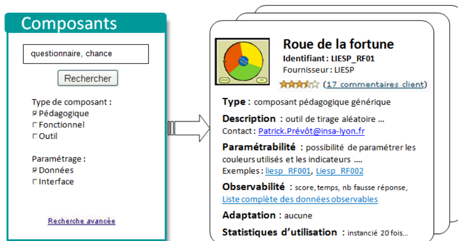
Figure 2. Palette pour chercher des composants en fonction des besoins