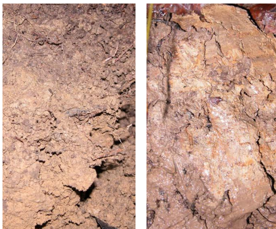
Figure 2 : 9 ans après le passage d'un tracteur sur un limon très fertile en Lorraine. A gauche, le « témoin » non circulé est aéré, il comporte des radicelles en surface et des lombrics. Dans la « zone de bordure » (voir figure 1), à 50 cm du premier profil, un pseudogley s'est créé en surface avec un horizon « léopard ». La porosité en est toujours absente et la teneur en eau est de l'ordre de 2 fois celle du sol intact. On voit très nettement les traces blanches et ocres dues à la mobilité du fer réduit car sans O^2 , à l'inverse d'un fer rouillé.

métabolisme anaérobie des micro-organismes du sol provoque la dissolution des oxyhydroxydes de fer et la migration des ions ferreux sous forme chélatée. Cette perte de fer (cation flocculant) dans les horizons supérieurs peut entraîner une augmentation de la dispersibilité des argiles à l'eau, du lessivage des argiles et de l'instabilité structurale.