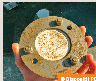
❸ Dispositif POCIS après une exposition de deux semaines dans une rivière.