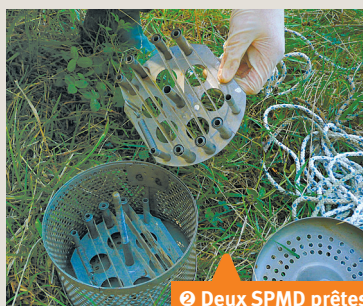
❷ Deux SPMD prêtes à être installées dans une cage de protection et déployées en rivières.