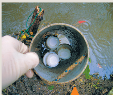
❶ Trois dispositifs DGT installés pour l'exposition en rivière.

Une membrane semi-perméable ( Semipermeable Membrane Device , SPMD) est constituée d'un tube en polyéthylène, renfermant une couche mince de lipide (trioléine) (Huckins et al. , 1993). Les pores de la membrane (diamètre maximal de l'ordre de 10 Å), ainsi que son hydrophobie permettent une solubilisation des composés organiques hydrophobes dans la membrane et leur migration jusqu'à la phase lipidique. Le dispositif, immergé dans le milieu aquatique (entre quelques jours et plusieurs mois) accumule donc les substances organiques hydrophobes (dont le coefficient de partage KOW est supérieur à 1 000) dissoutes et libres du milieu. Les PCB* (polychlorobiphényles), les HAP* (hydrocarbures aromatiques polycycliques), les pesticides organochlorés ou encore les phénols ou benzènes chlorés par exemple seront facilement accumulés. Les contaminants plus hydrophiles (résidus pharmaceutiques, pesticides hydrophiles...) ne seront pas concentrés.