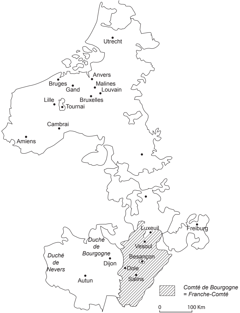
Figure 1 : Les États bourguignons à la mort de Charles le Téméraire (1477)