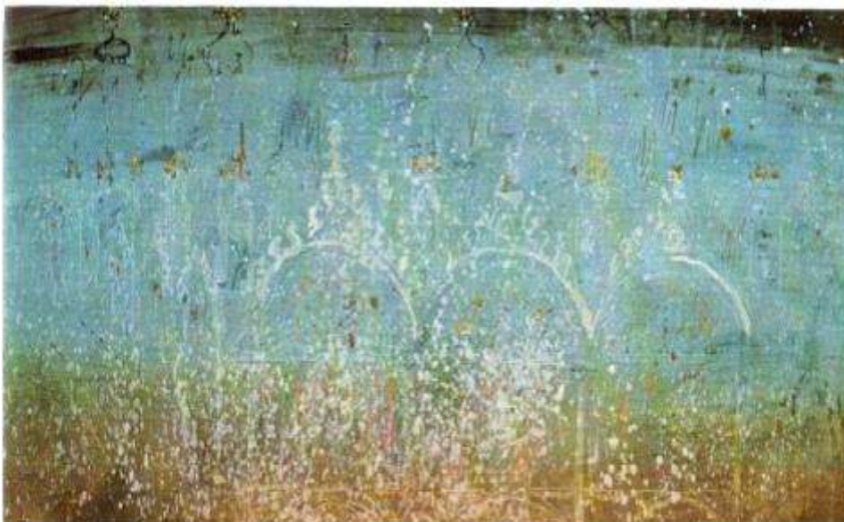
Étude de John Piper pour Death in Venice (1973))