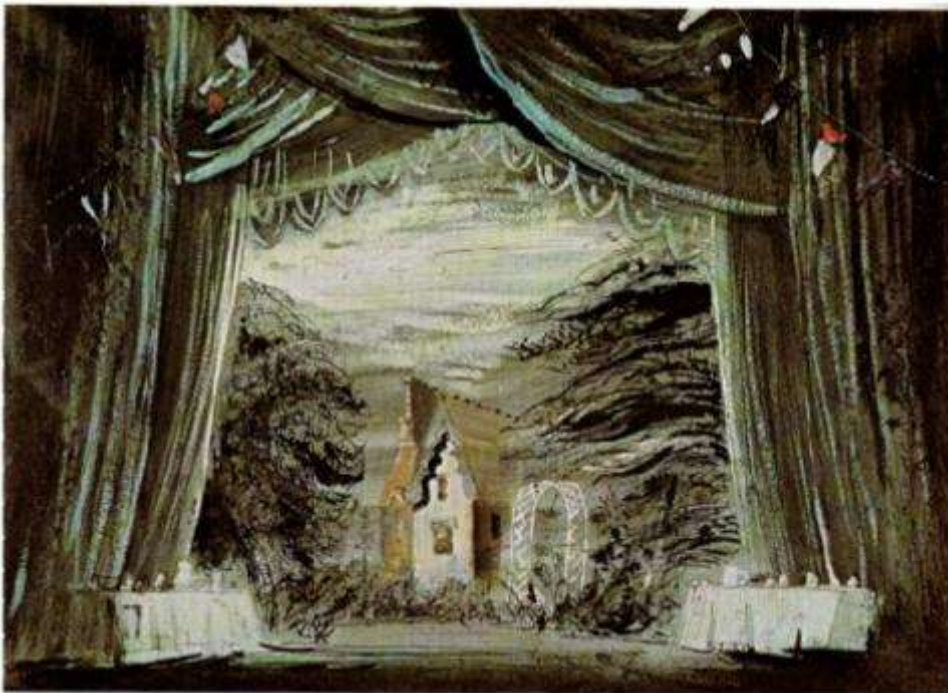
Étude de John Piper pour Albert Herring (1947)