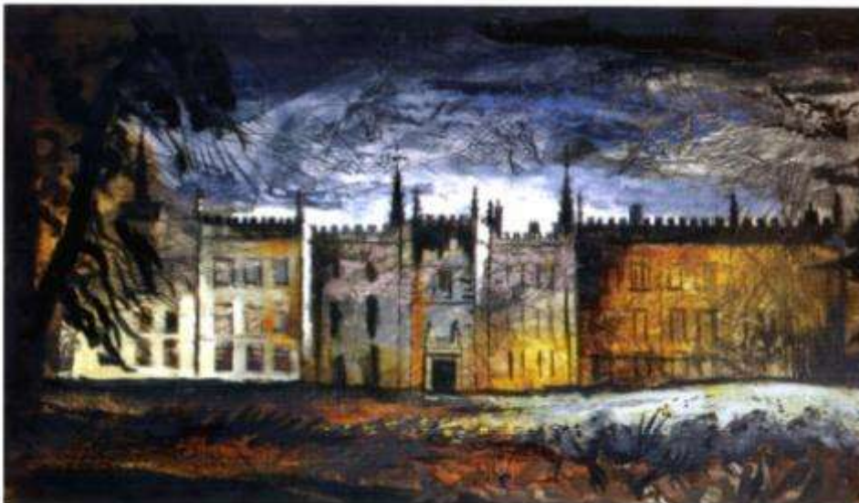
Illustration 1: Renishaw, the North Front (1942-45).