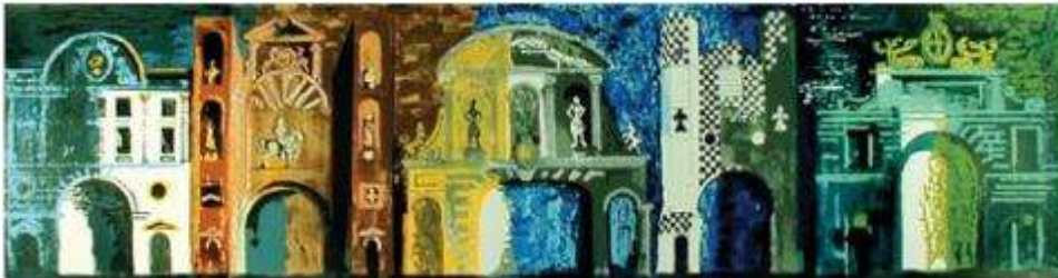
Sérigraphie, 43,2 x 160 cm