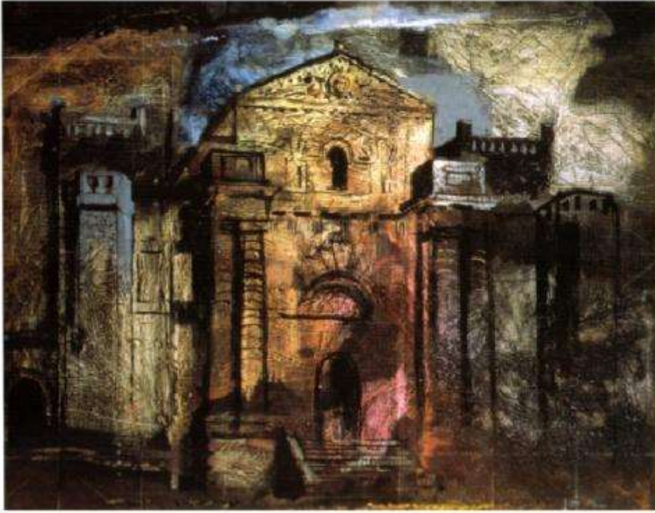
Huile sur toile, 63,5 x 76,2 cm. Tate Gallery