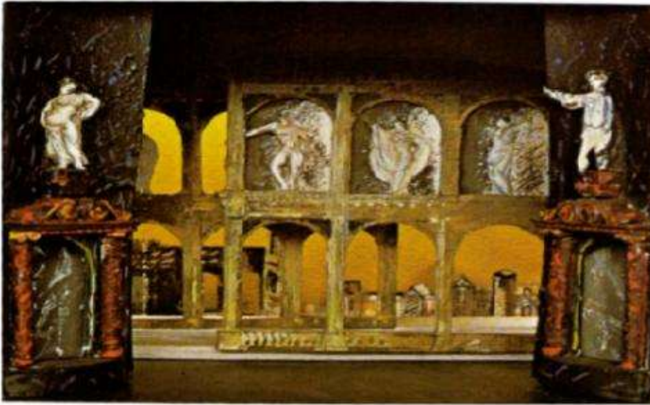
The Rape of Lucretia (1946)