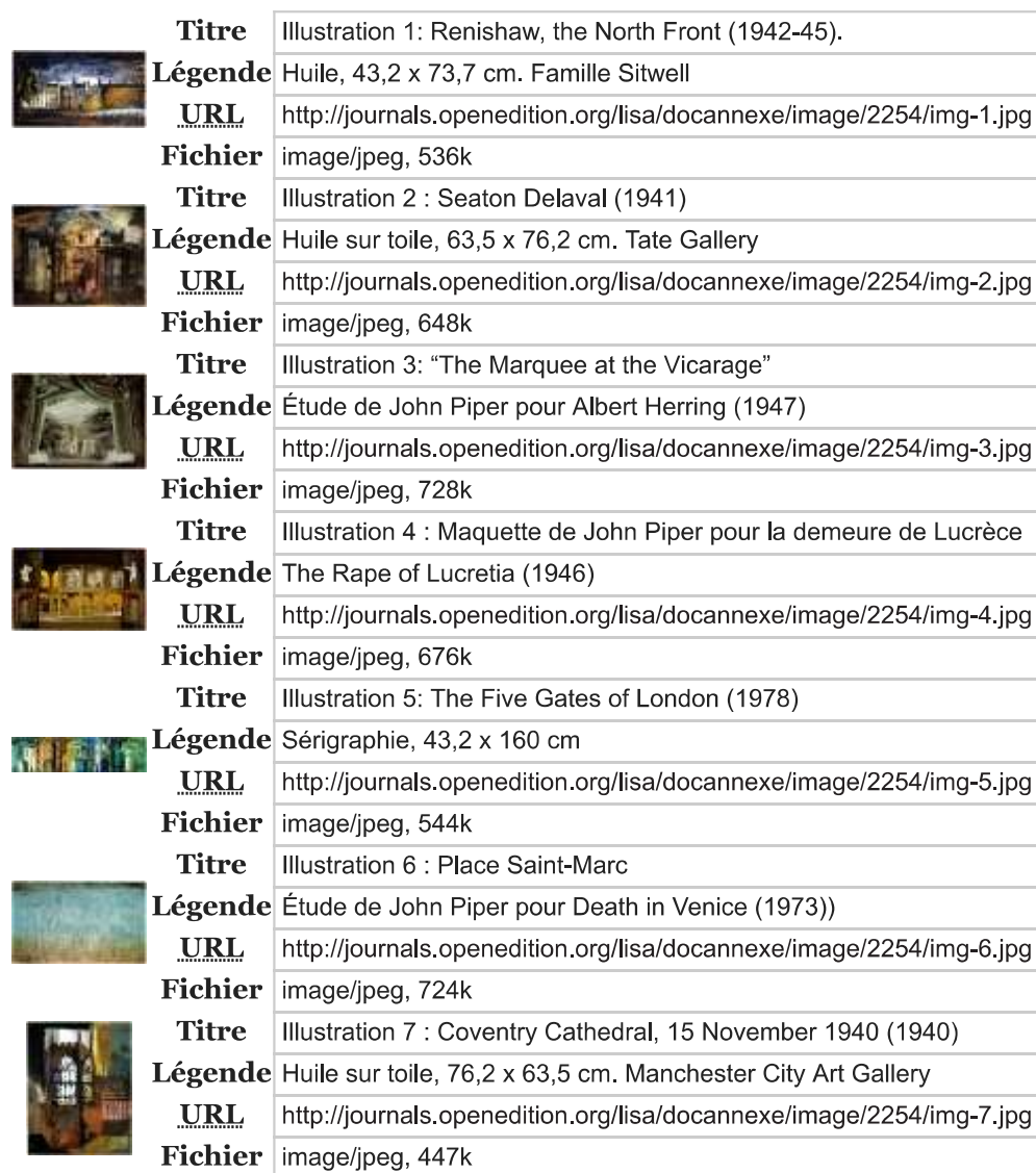
Table des illustrations

49 William R. Trumble et Angus Stevenson (Dir.), New Shorter Oxford English Dictionary , Oxford: Oxford UP, (5ème édition) 2002.