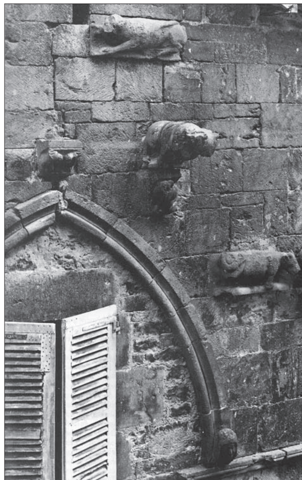
FIG. 3. CAYLUS, MAISON DITE DES LOUPS: détail de l'élévation sur rue. Extrait de l'ouvrage Caylus et Saint-antonin-Noble-Val (Tarn-et-Garonne), fig. 272.

notamment dans les arcades » (55). A. Marin relève l'usage omniprésent de la pierre et la qualité de sa mise en œuvre dans les maisons de Tournon-d'Agénais, avec l'intervention du tailleur de pierre pour les encadrements de baies et d'aménagements domestiques (56). On relèvera le cas particulier de Montpellier où les parements sont montés dans un petit appareil alterné. Si caractéristique qu'il a été dénommé « appareil de Montpellier » (dit « carettes et