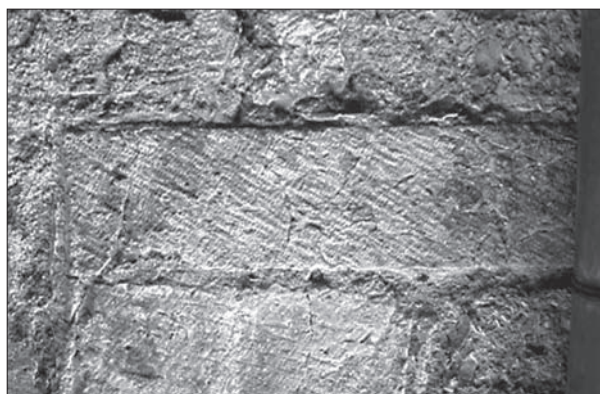
FIG. 5. MARTEL (LOT), maison de la rue Droite, traces de taille bretturée.

Au degré de façonnage de la pierre sont attachés un certain nombre de paramètres techniques, économiques et esthétiques. Plus le matériau est retouché, plus il est onéreux, mais plus il est apte à donner un bel appareil, soigné. La pierre de taille bien calibrée donne une plus grande régularité à l'appareil et diminue l'épaisseur des joints à l'inverse du galet ou du moellon éclaté ou même équarri. La pierre de taille coûtant cher, elle est souvent combinée avec le moellon. À Aix, le parement est en pierre de taille simple (façade) ou double, l'appareil est réglé, lié au mortier de chaux à joints maigres. Il y a souvent différenciation entre le rez-de-chaussée, monté en appareil de pierre de taille ou de moellons liés à la