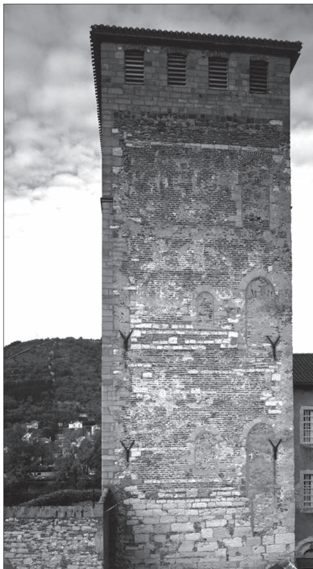
FIG. 11. CAHORS, PALAIS DE VIA, élévation ouest de la tour. Extrait de l'ouvrage de M. Scellès, Cahors, ville et architecture civile au Moyen Âge (XII e -XIV e siècles), fig 143.