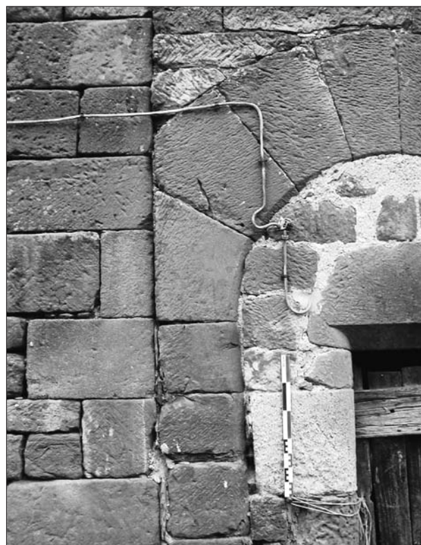
FIG. 4. MOURET (AVEYRON), maison du bourg castral, traces de broche et de taillant droit.