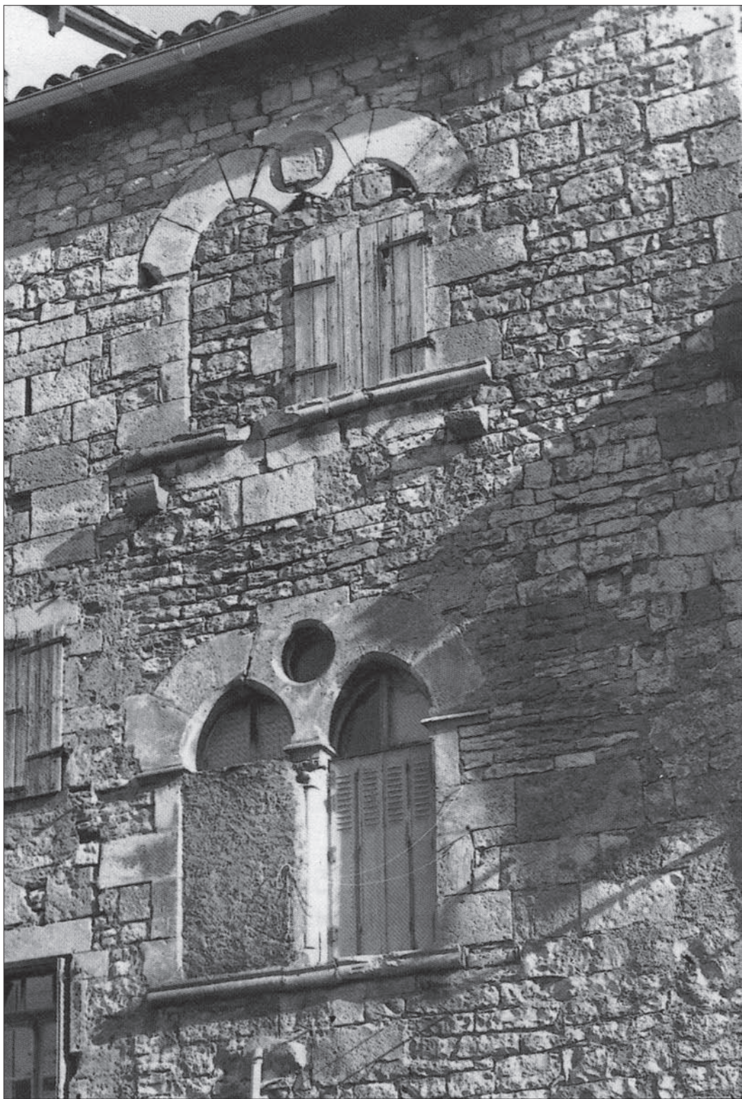
FIG. 9. SAINT-ANTONIN-NOBLE-VAL (TARN-ET-GARONNE), MAISON 5, RUE GUILHEM-PEYRE, élévation postérieure des 1 er et 2 e étages. Extrait de l'ouvrage Caylus et Saint-Antonin-Noble-Val (Tarn-et-Garonne), fig. 264.