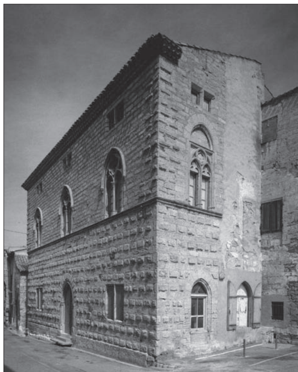
FIG. 1. POUSSAN (HÉRAULT), appareil à bossage au rez-de-chaussée et chaîne d'angle. Extrait de l'ouvrage Montpellier: la demeure médiévale, fig. 99.