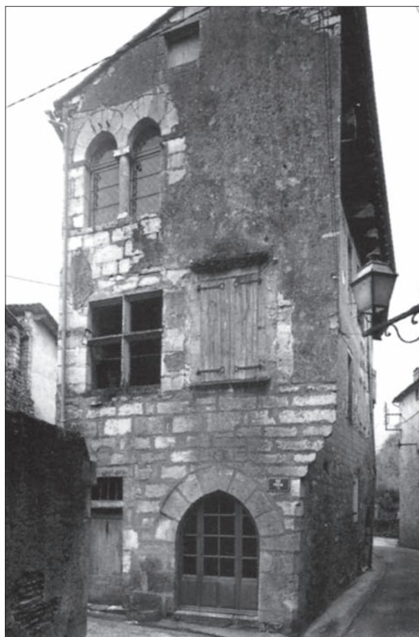
FIG. 12. SAINT-ANTONIN-NOBLE-VAL, maison rue Frézal, élévation qui à l'origine (XIII e ou XIV e siècle) était en pans de bois. Extrait de l'ouvrage Caylus et Saint-antonin-Noble-Val (Tarn-et-Garonne), fig. 252.