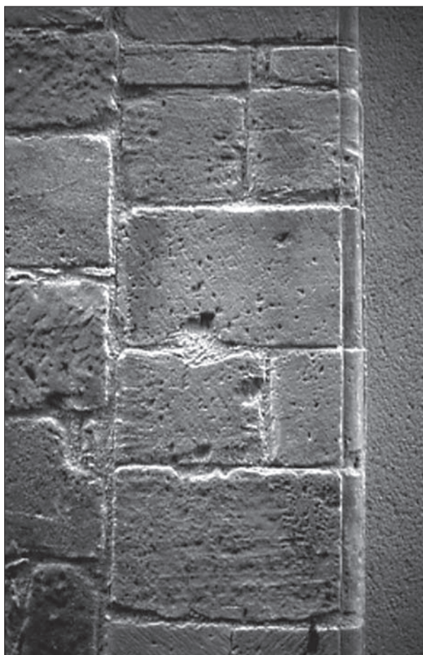
FIG. 6. FIGEAC (LOT), maison de la rue Gambetta, traces de taille layée.