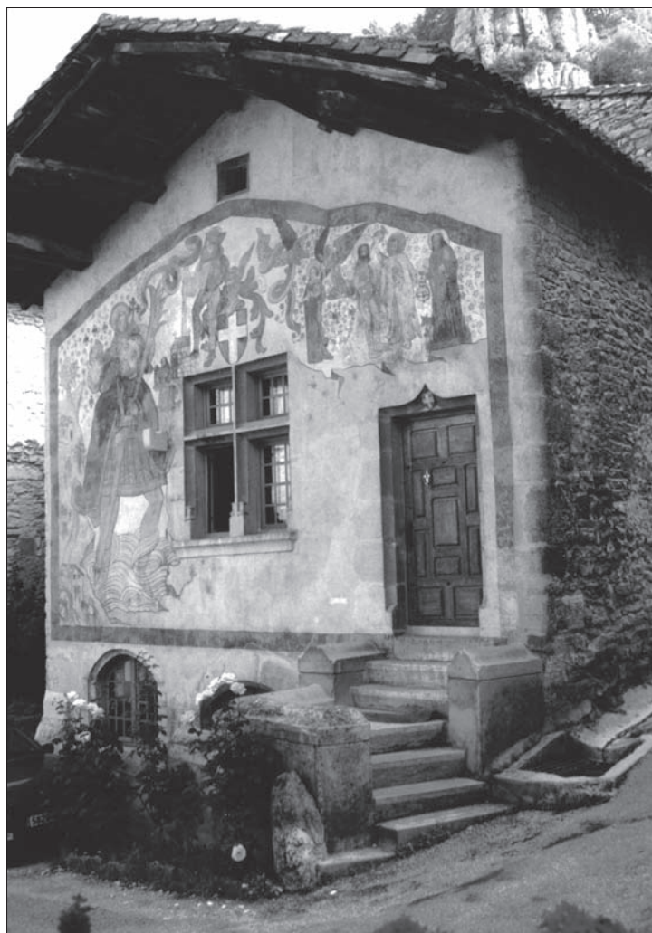
FIG. 15. SAINT-SORLIN-EN-BUGEY (Ain), façade d'une demeure du XV e siècle recouverte d'un enduit peint.

Parmi les questions qui restent posées, celle de particularités propres à la maison, dans la mise en œuvre de la pierre , par rapport à d'autres types d'édifices. Chaque fois qu'on a pu l'observer, chaque fois qu'une comparaison a été faite entre églises, demeures seigneuriales et aristocratiques et maisons urbaines, il n'a pas été constaté de décalage technique ni chronologique majeur, mais seulement une différence de programme et de moyens (107). C'est tout particulièrement vrai dans les bourgs monastiques (108) où, en matière de techniques de construction, le chantier monastique est source d'apports irremplaçables (ouverture de carrières, présence de nombreux praticiens du bâtiment, séjour de sculpteurs, etc.). La symbiose entre l'abbaye et son bourg se discerne dans l'expression matérielle de celui-ci, dans les caractères de son habitat et la chronologie de sa constitution (109).