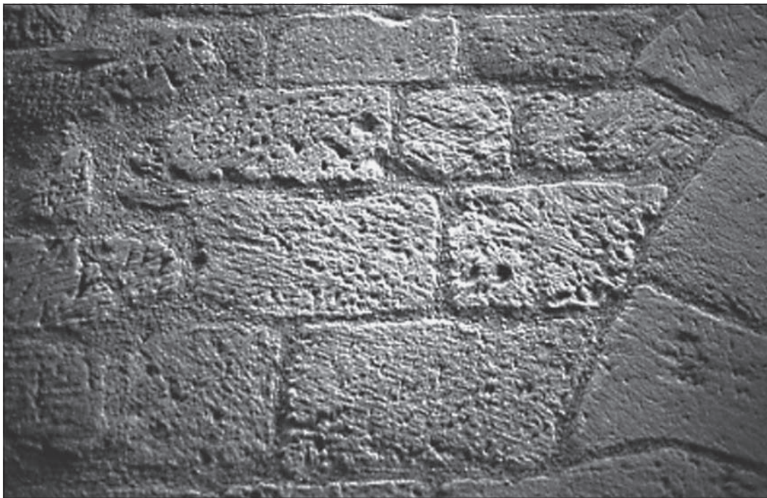
FIG. 7. FIGEAC (LOT), maison de la rue de Clermont, taille layée.