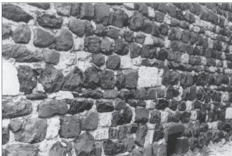
FIG. 14. SAINT-PONS-SOUS-COIRON, détail de l'appareil d'une maison du XVI e siècle. Extrait de l'article d'Y. Esquieu « La pierre de ramassage dans la construction médiévale... », fig. 4.

Le coût de la pierre de taille invite à l'économie et explique la différence de traitement entre la façade principale, parementée en pierre de taille, et les façades latérales ou arrière, moins soignées. Ce souci d'économie est encore plus marqué dans l'architecture civile de Basse Auvergne où la lave est parfaitement taillée et dressée sur les façades sur rue, alors que les murs moins ou non vus sont en appareil de moellons enduits. Cette pratique vaut également pour les parements intérieurs et les parois des caves. Le double parement n'est pas de règle et les murs sont fréquemment des massifs de moellons, avec placage éventuel de pierres de taille sur une face (98). C'est aussi une question de coût, et de rapidité. À Saint-Antonin-Noble-Val, la pierre de taille qui anoblissait, jusqu'au XIV e siècle compris, les façades principales sur la rue, est abandonnée. La maçonnerie de moellons, enduite ou non, se généralise dans le siècle suivant (99).