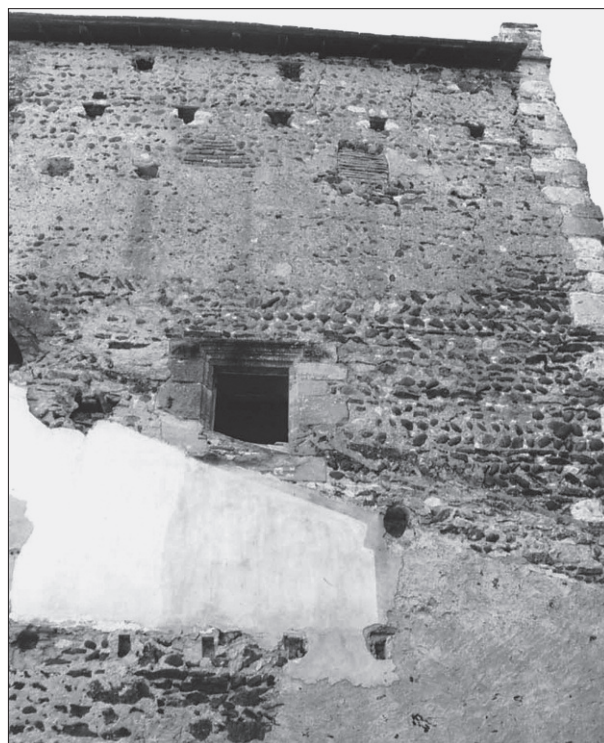
FIG. 13. MAÇONNERIE EN GALETS: maison Belluix à Morlanne (Pyrénées-Atlantiques).

dite « en feuille de fougère ». Les chaînages d'angle sont en gros blocs équarris de calcaire lacustre « de l'Armagnac », en assises de 0,60 à 0,70 m de hauteur, tandis que les encadrements de baies ont été exécutés en grès molassique, plus propre à la sculpture. A. Marin, souligne le peu de soin apporté aux faces des pierres d'encadrement en contact avec la maçonnerie, contrastant avec le raffinement de la taille des moulures. Cette tendance à l'économie s'explique par la présence d'un enduit qui subsiste à l'état résiduel, rehaussé d'une couleur claire qui a été appliquée sur les encadrements des baies, comme en témoignent des traces dans le creux des moulures. La brique n'est présente ici que de manière très marginale. Tandis qu'on a probablement utilisé des échafaudages à deux rangées de perches dans la partie inférieure, des lignes de trous de boulins apparaissent à partir de 8 m de hauteur. Assez grands (0,20 m de côté), ils suggèrent des boulins traversants de forte section soutenant seuls des platelages, éventuellement confortés par des équerres en bois (90).