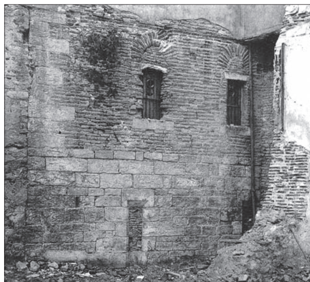
FIG. 10. CAHORS, MAISON RUE DU PONT-NEUF, construction mixte avec rez-de-chaussée et chaîne d'angle en pierre et étage en briques. Extrait de l'ouvrage de M. Scellès, Cahors, ville et architecture civile au Moyen Âge (XII e -XIV e siècles), fig. 139.