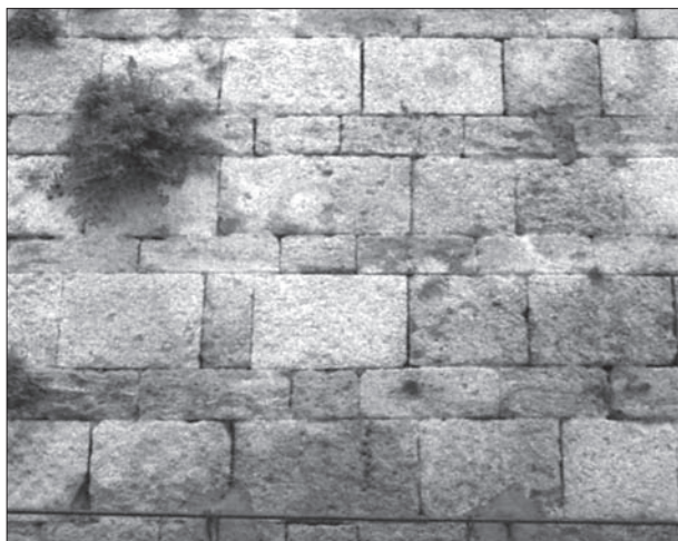
FIG. 2. PIGNAN (HÉRAULT), tour du château, détail de l'appareil alterné « dit de Montpellier » ou « à carettes et jasens ». Extrait de l'ouvrage Montpellier: la demeure médiévale, fig. 160.