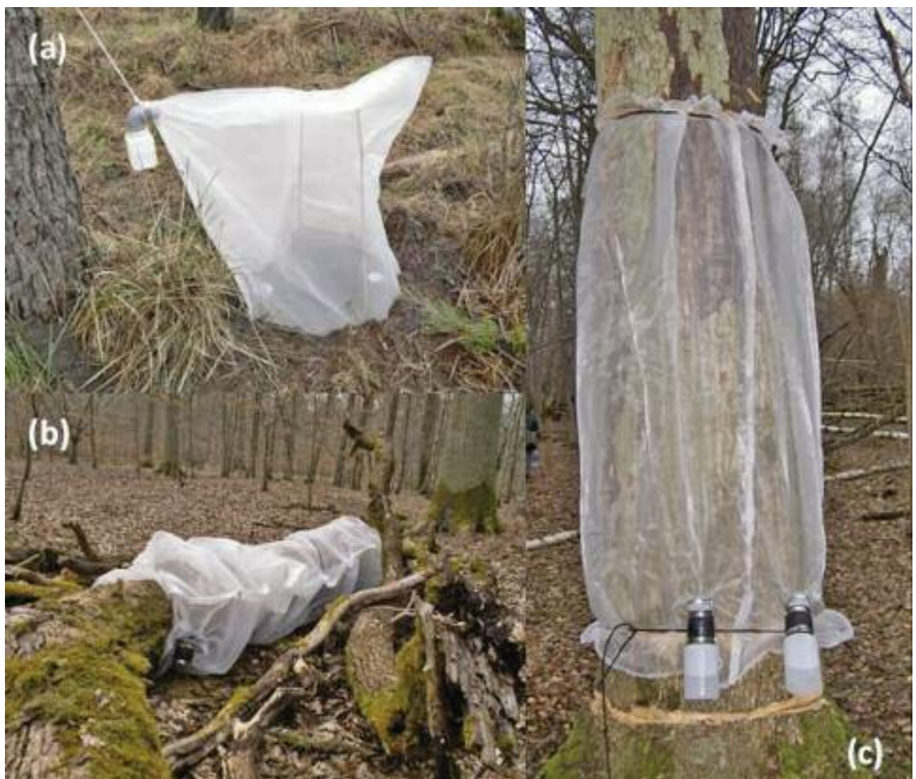
Fig. 2 : quelques micro-habitats clés du bois mort, équipés de nasses d'émergence pour l'échantillonnage de leur faune caractéristique : (a) souche de pin maritime, (b) gros bois mort gisant de chêne, (c) chandelle de chêne