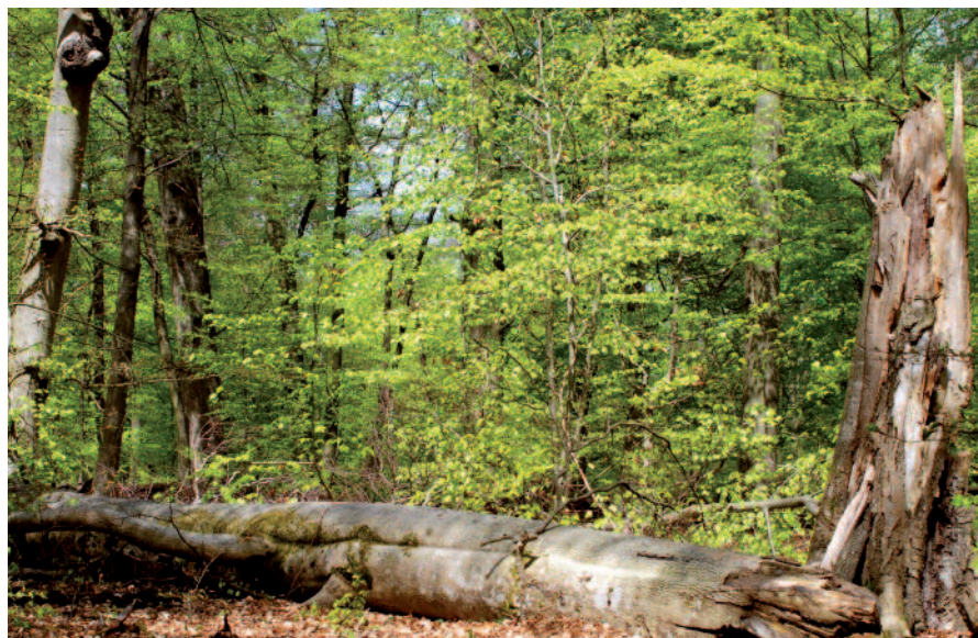
A.M. Granet, ONF

Du bois mort peut être laissé à l'écart des zones fréquentées sans que cela soit considéré comme négligence ou imprudence du gestionnaire