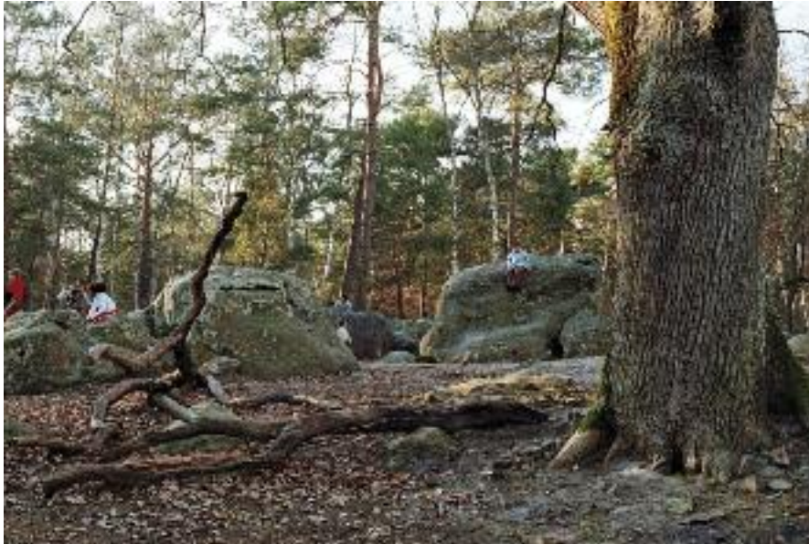
A.M. Granet, ONF