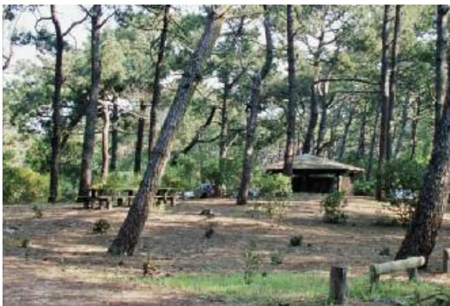
A.M. Granet, ONF

DOBRÉ M., GRANET A.M., 2007. La forêt des jeunes. Rendez-vous techniques de l'ONF n°17, pp. 61-67