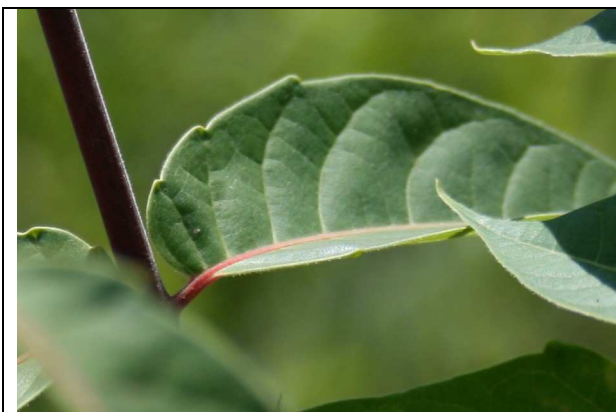
Photo n°1 : Feuille dentée à la base (Castifao, Corse) – Yann DUMAS (2008)