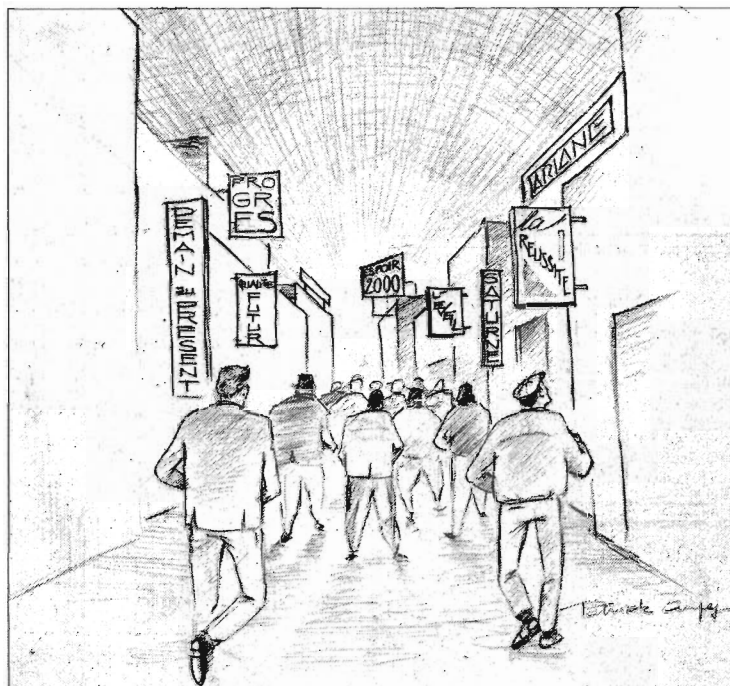
Les noms des cercles de qualité rappellent qu'ils veulent préparer l'avenir.

Mais attention aux effets pervers. Quels peuvent être les enjeux des ouvriers ainsi mis en compétition? Le contremaître de la chaîne estime que «les gars, ils ont deux choses sur lesquelles ils ne veulent pas être attaqués. Ils ne veulent pas être attaqués sur la qualité de leur travail et ils ne veulent pas être le dernier du module». Or, il y a deux moyens d'être bien placé: soit faire peu de défauts, soit que les autres en fassent plus. C'est pourquoi un monteur, s'il s'aperçoit de l'oubli d'une pièce au poste