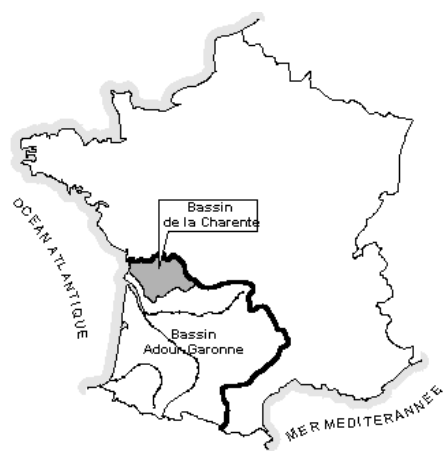
Figure 1. Bassin de la Charente

C'est toutefois sur le bassin de la Charente-Amont (à l'amont de la ville d'Angoulême), et plus particulièrement sur l'unité de la Charente amont dite « restreinte » (Figure 2) que les plus forts déséquilibres s'observent. Cette unité, d'une superficie de 1640 km 2 , est constituée du fleuve et de sa nappe d'accompagnement.