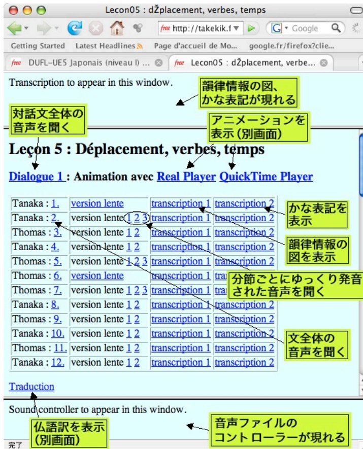
図3：対話文音声、アニメーション、韻律情報の視覚化とかな表記

http://takekik.free.fr/japonais/lecon05/