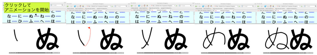
図1：ひらがなアニメーションの一例「ぬ」

まず始めに、プレゼンテーションソフト (Powerpoint) で書き順を示すアニメーションを作成した。次に、スクリーン上の動きを動画として記録するソフト Camtasia Studio を用いてこれを録画、書き順を再現した。その際に筆者が当該のかな文字の音声を、文字の座標軸上の上下と声の高さ (ピッチ) をできるだけ一致させつつ録音した (上から下、左上から右下等に向かう動きに合わせて下降調、その逆は上昇調)。