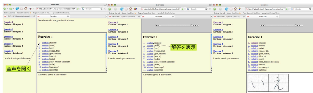
図2：ひらがな書き取り練習の一例「いえ」

授業時間外に聞き取りおよび書き取り練習ができるよう、音声ファイルと解答の文字を表す画像ファイルを表示することができるようなhtmlページを作成した。音声ファイルは「1. (いち)『いえ』とかいてください」というような指示文を録音したものを、解答としてはマスに手書きで書いた文字をスキャンしたものを提示した。