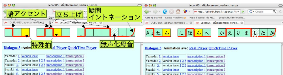
図5：韻律情報の図式（左）およびかな表記（右）

特殊拍や無声化した母音を含む拍など、学習者が把握しにくい拍を色分けして拍の数を示し、加えて語アクセント（分節中の主たる下降のみを表示）とイントネーション（分節頭の立ち上げ、疑問イントネーション）を図式化したものを表示することができるようにし、音声を聞く際のがかりとなるようにした。