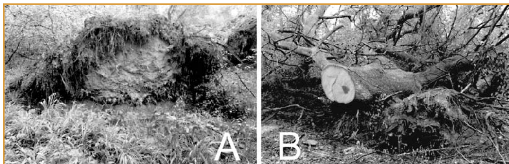
▲ Figure 3 – Gestion courante et micro-habitats issus de perturbations naturelles. Dans la gestion courante, faut-il chercher à imiter le régime de perturbation naturelle dans ses moindres détails (comme la galette de chablis en figure A, qu'il est difficile de produire par des techniques d'exploitation classiques), ou essayer de proposer des évolutions de l'exploitation s'inspirant de ce régime et d'autres considérations (comme le houppier non démembré en figure B) ? Nous optons pour la seconde alternative.