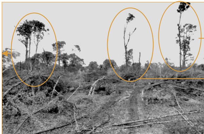
▲ Figure 2 – Comparaison de trois scénarios d'exploitation des semenciers ou des sur-réserves.