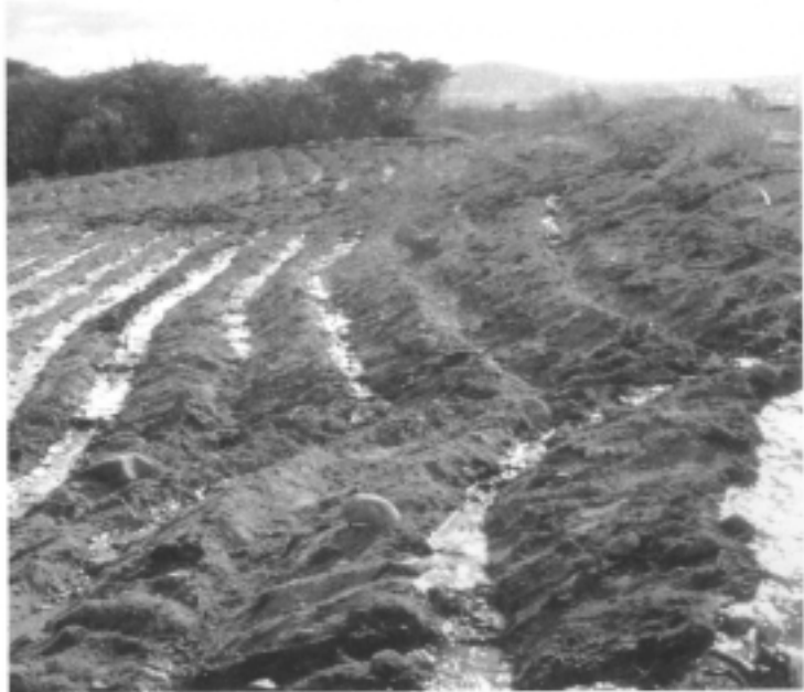
▲ Photo 2. – Exemple d'irrigation sur une parcelle en pente dans la ZARI d'Urququi.

L'inventaire des principales cultures est réalisé à partir d'une procédure de classification classique en télédétection consistant en une classification par maximum de vraisemblance sous hypothèse gaussienne. On introduit des probabilités a priori d'apparition des différents thèmes en fonction de l'étage climatique, qui seules permettent de différencier les cultures dans le cas de la région d'Urququi.