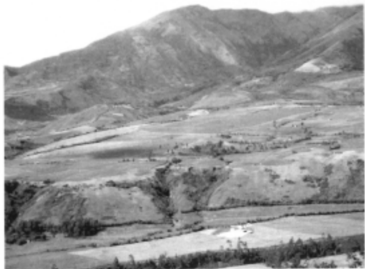
▲ Photo 3. – Paysage de l'étage tempéré sur la ZARI d'Urququi. Deux canaux d'irrigation parallèles apparaissent nettement au flanc du versant en contrebas du plateau, grâce à la végétation qui les borde.