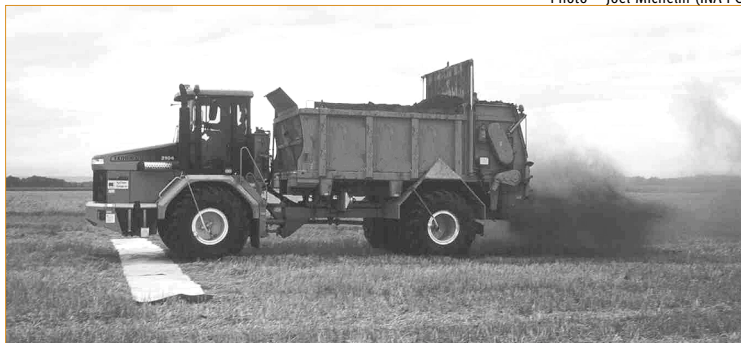
▲ Photo – Chantier d'épandage avec un engin auto-moteur.