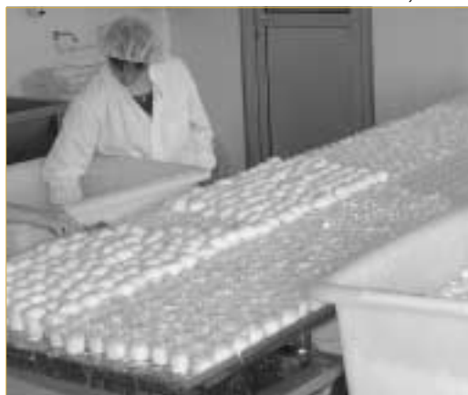
◀ Photo 2 – Dans la perspective de zone IGP, l'objectif politique peut être de privilégier les entreprises agro-alimentaires.