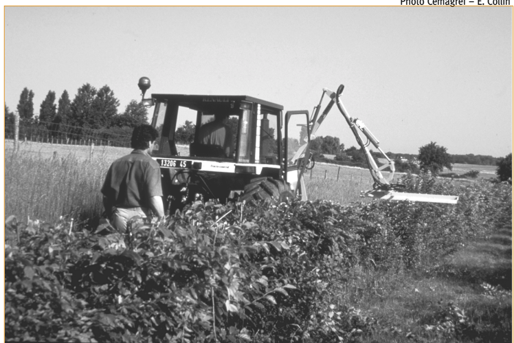
▲ Photo – Conservatoire d'ormes taillé en haies basses.