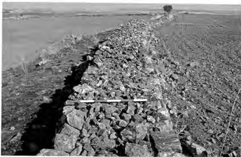
Fig. 31. El Pedrosillo (Casas de Reina). Lienzo del campamento grande (J. G. Gorges & G. Rodríguez Martín).

del recinto grande, cerraba con toda probabilidad en las otras caras por una empalizada de madera ( vallum ). En el lado este y sur estaba protegida por un foso, cuyos rastros residuales se pueden apreciar en las fotografías aéreas de 1956, y, en el oeste, por la continuación del afloramiento rocoso que cruza el gran recinto. La superficie protegida ocupaba un espacio en torno a las 3, 5 ha., con lo que la superficie total de los dos recintos principales se eleva a 13, 4 ha.