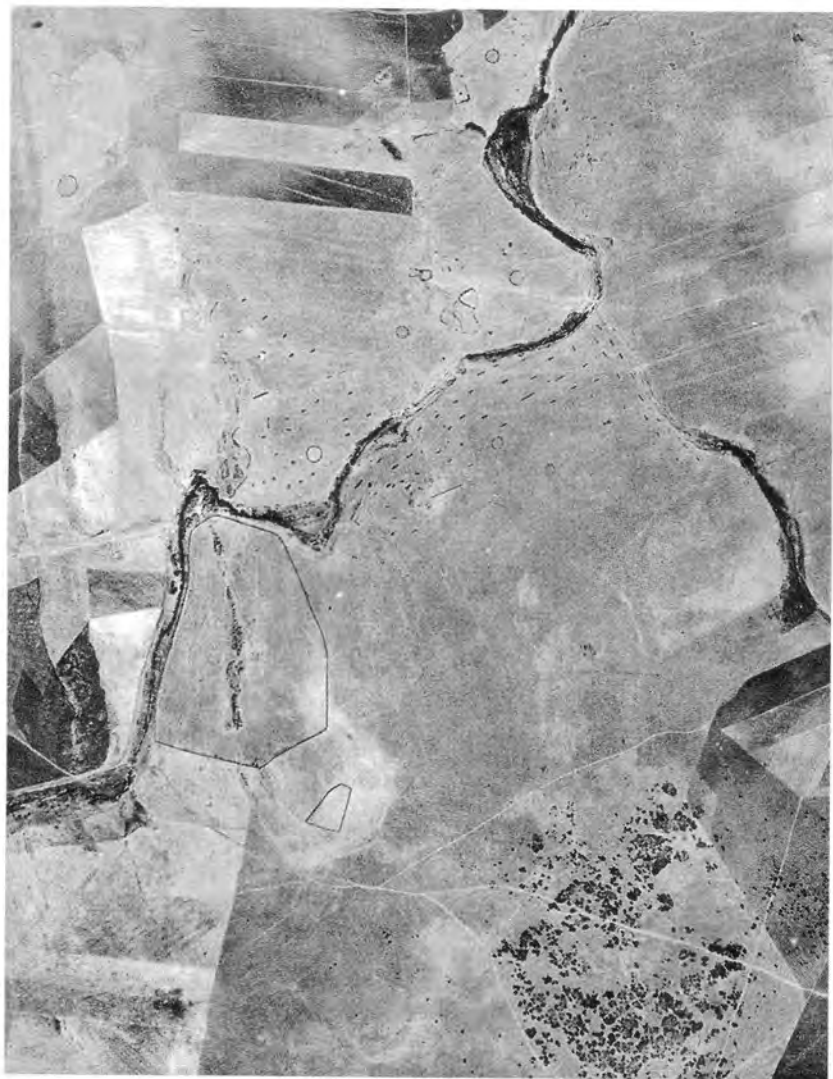
Fig. 29.El Pedrosillo (Casas de Reina). Fotografía aérea.