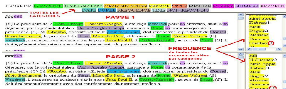
Figure 4. Visualisation des EN reconnues par double lecture

Les résultats obtenus par application des grammaires locales sont traités par un programme qui effectue un traitement en deux phases nécessitant chacune une lecture du texte. Lors de la première phase, les EN reconnues sont mémorisées dans un lexique. On recherche également dans le texte les séquences de mots qui commencent par une majuscule et qui ne sont pas reconnues. Ces séquences sont étiquetées « NON RECONNU ». Lors de la seconde phase, ces séquences sont recherchées parmi les EN déjà mémorisées. Après comparaison, celles qui sont des occurrences d'une EN déjà mémorisée sont étiquetées de la même manière. Ceci permet d'accroître le taux de reconnaissance des EN. Les changements de fréquences dans le lexique en témoignent (cf. Figure 4).