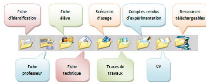
Figure 1 - La structure du modèle de ressources 2006

Enfin, une dernière fiche a été ajoutée au modèle (Fig. 1) : le curriculum vitae (CV), cohérent avec la notion de vivier de ressources, permet de garder les traces des évolutions marquantes de la ressource.