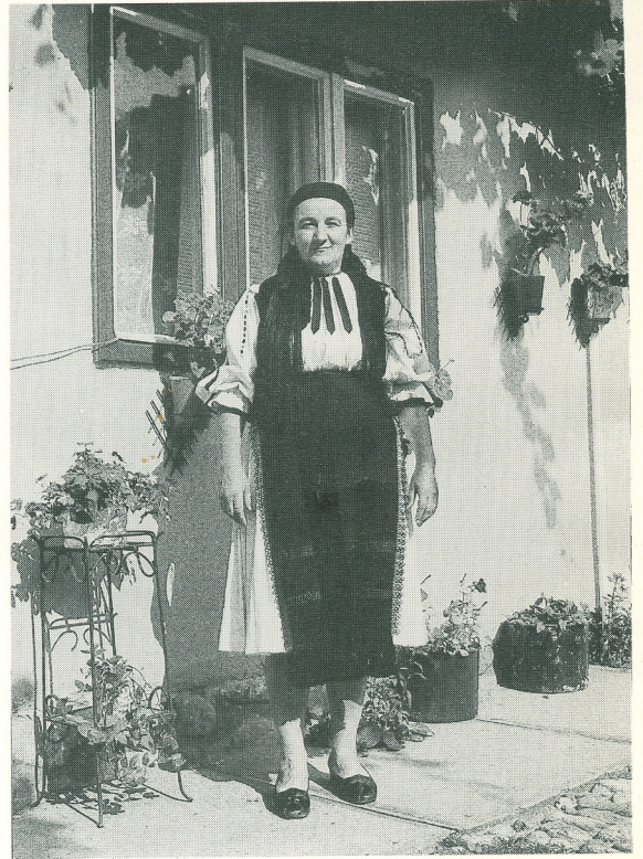
6. Second modèle de tablier roumain porté dans la région de Făgăras

Un fils et sa mère, village de Copăcel. Le costume de la femme comprend un tablier orné de grosses fleurs multicolores.