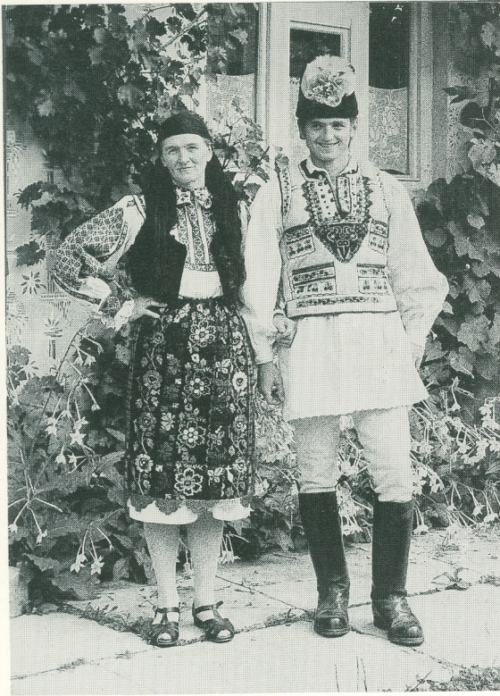
5. Premier modèle de tablier roumain porté dans la région de Făgăras

Un fils et sa mère, village de Copăcel. Le costume de la femme comprend un tablier orné de grosses fleurs multicolores.