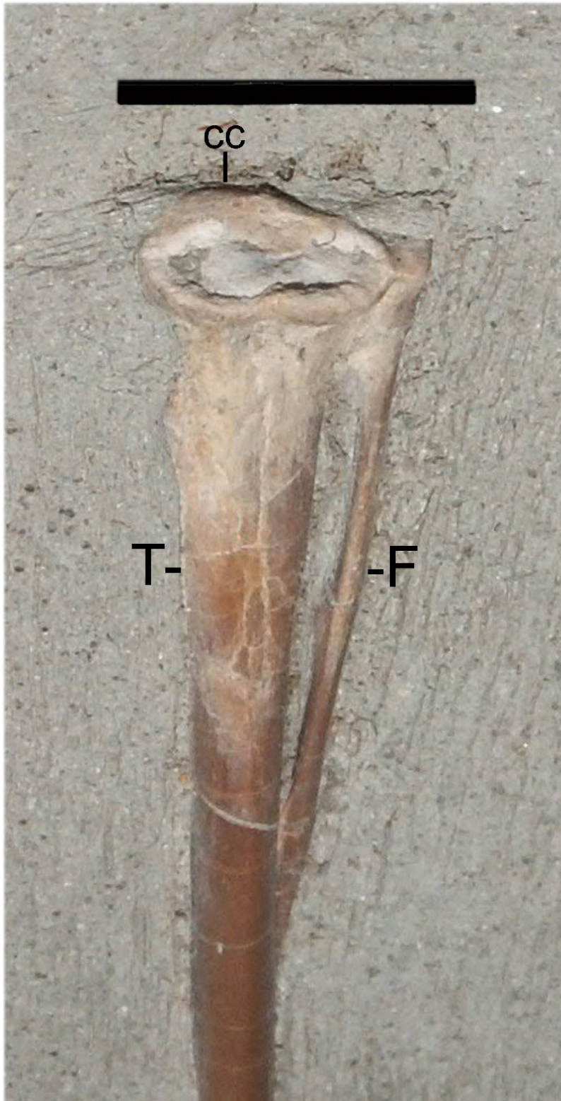
◀ Figure 2: Tibia-fibula of a pterosaur ( Dorygnathus sp.) from the Toarcian of La Croisette, near Charleville-Mézières (Ardennes, northeastern France), Musée des Minéraux, Roches et Fossiles des Ardennes, Bogny-sur-Meuse, n° A479. Close-up of the proximal part in posteroproximal view. Cc: cnemial crest; F: fibula; T: tibia. Scale bar: 10 mm. [Figure 2 : Tibia-fibula de ptérosaure ( Dorygnathus sp.) du Toarcien de La Croisette, près de Charleville-Mézières (Ardennes), Musée des Minéraux, Roches et Fossiles des Ardennes, Bogny-sur-Meuse, n° A479. Détail de la partie proximale en vue postéro-proximale. Cc : crête cnémienne ; F : fibula ; T : tibia. Barre d'échelle : 10 mm.]

The fibula is a thin bone that is fused to the lateral side of the tibia proximally, then separates from it for about 17 mm, leaving a narrow interosseous space between the two bones, and then meets the tibia again and fuses with it so that it can no longer be distinguished. The visible part of the fibula is thus about one-third the length of the tibia. The proximal head of the fibula is distinct from that of the tibia and forms a flat, square facet.