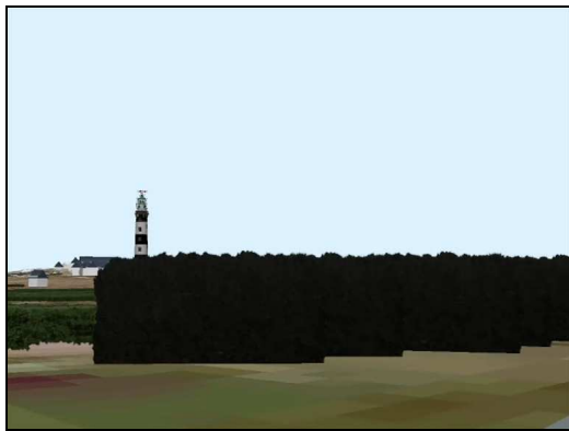
Fig. 1. Exemples de simulations 3D réalisées selon un scénario d'évolution paysagère déterminé