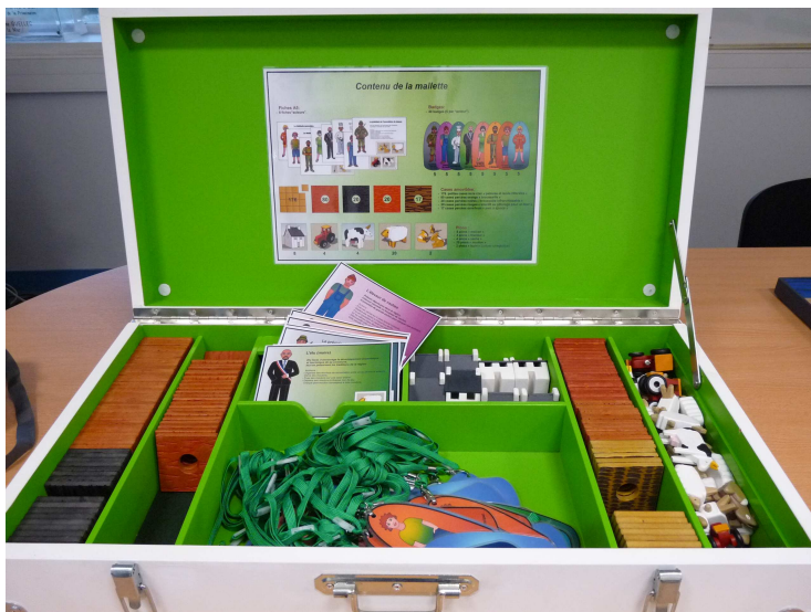
Photo 2. La mallette de jeu