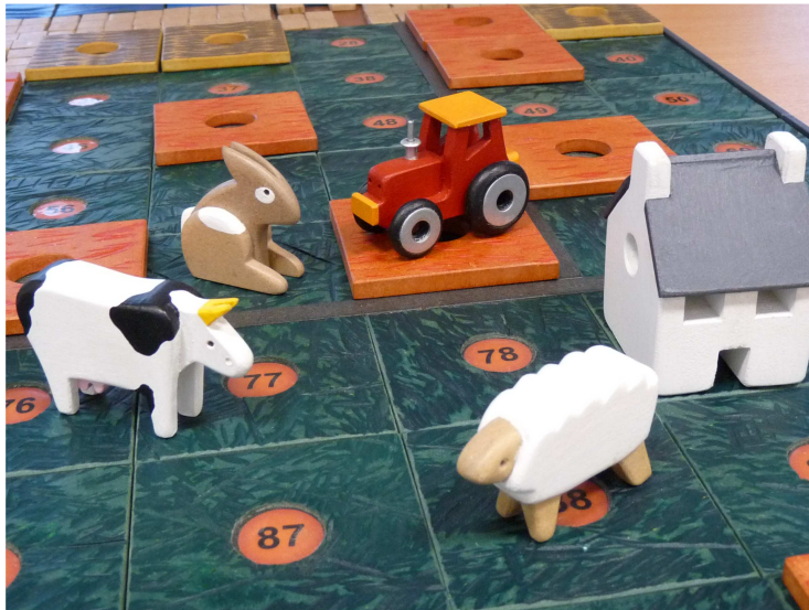
Photo 1. Le nouveau plateau de jeu