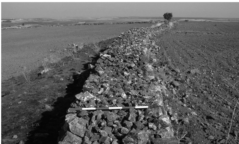
Fig. 3. Detalle de la muralla del recinto grande (Lado sureste).

llado conserva una altura muy regular a lo largo de casi todo el perímetro, entre 1 m y 1,20 m., lo que supone una altura muy cercana a la que debió tener en su origen, cuya cota sin duda se situaría entre 1,40 m y 1,50 m. Para conseguir mayor seguridad y una mejor cohesión, el paramento interno del muro no es vertical, sino ligeramente inclinado, con lo que la base de la muralla es más amplia, aproximadamente unos 0,30 m., que la parte superior (Fig. 3). Lo mismo ocurre con el coronamiento, que está concebido como un plano inclinado, donde el paramento interno es siempre más alto –unos treinta cm.– que el paramento exterior, que es vertical. En cuanto a la base, el lienzo se apoya en una zapata reforzada de piedras a lo largo de todo el agger . Este largo muro está flanqueado por dos taludes laterales: uno externo, con pendiente y pronunciado desnivel (entre 1 y 1,50 m aproximadamente) y el otro interno, menos señalado. En el interior del recinto, desde donde siempre se domina el exterior, da la impresión que gran parte del suelo ha sido nivelado. A modo de espina dorsal, un afloramiento rocoso, nivelando en la parte central, divide el campamento en dos partes, manteniendo un eje groseramente norte-sur. En medio, o sea en el centro del campamento y el punto más elevado, se abre un espacio panorámico obviamente preparado ( praetorium? ) que permite dominar no solamente el interior del acuartelamiento, sino también la totalidad del complejo.