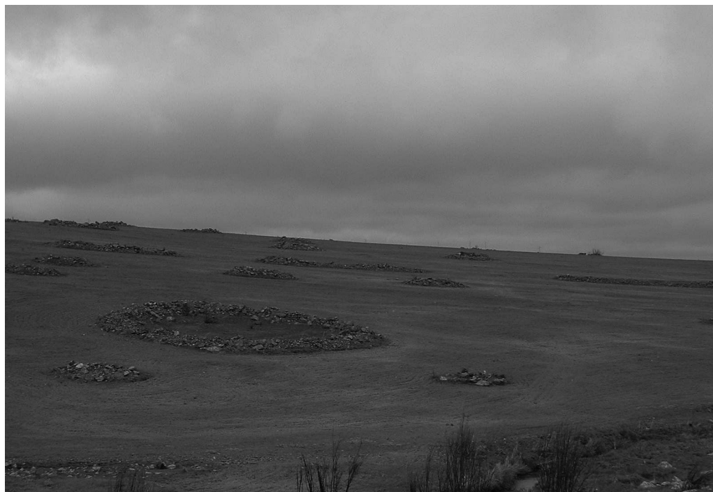
Fig.4. Recintos circulares (c5) y titula en la orilla izquierda del arroyo Pedrosillo. La reciente reanudación de los trabajos agrícolas con potentes medios mecánicos está conduciendo a la desaparición de los vestigios antiguos mediante la acción de despedregar la zona.