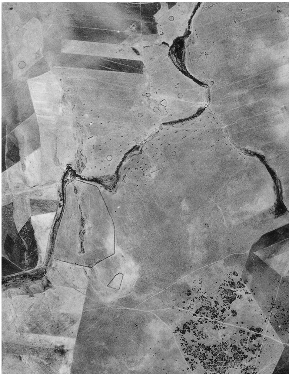
Fig. 2. Vista de conjunto de la parte central del complejo militar según una fotografía aérea vertical de 1956 (Vuelo Americano, foto 19.028 del 06/08/56).

ampliamente con la retama, lo que viene a caracterizar a la parte meridional del lugar (“Las Matas del Pedrosillo”). En líneas generales, el sector del Pedrosillo disfruta de numerosas ventajas para el establecimiento de un campamento militar de campaña: está situado en el centro de una zona de escasos relieves con amplias vistas panorámicas; se beneficia de puntos de agua permanente; de una amplia zona de praderas y pasto (pastizal); de un amplio espacio de un bosque residual de encinas, y sobre todo, gracias a la abundancia de piedra en superficie, de un material de construcción práctico e inagotable.