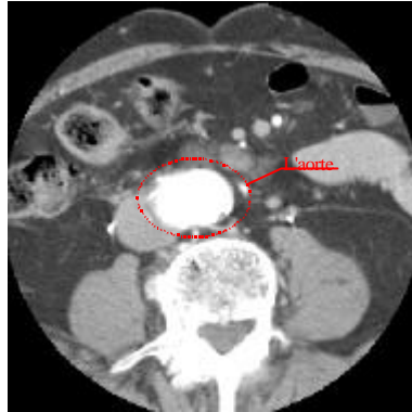
Figure 1. - Mise en évidence de l'aorte

L'exploitation d'une telle quantité de données représente un travail lourd et complexe à mettre en œuvre sur un réseau où les utilisateurs de l'outil de télédiagnostic se connectent avec un navigateur WEB. Par conséquent, dans le cadre du projet STIMAT, un script PHP associé à un serveur a été produit pour transformer le format DICOM en JPEG non destructif [BOU00]. Le JPEG ayant l'avantage d'être approprié au réseau, de plus il est exploitable dans un programme JAVA.