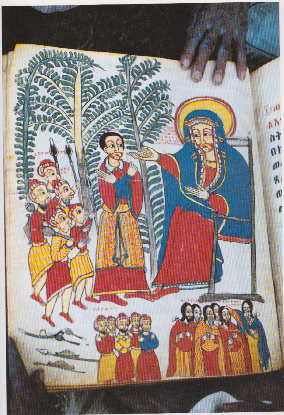
Taamra Maryam, Esté, 1682-1706