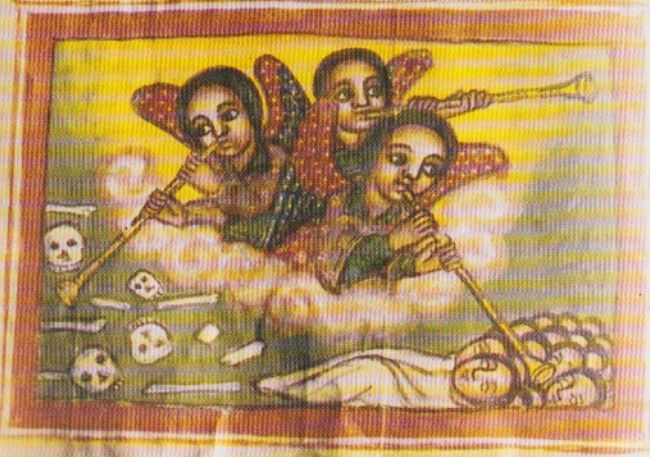
Dersana Mikael, Narga Sellassé (EMML 8366), fol. 157v, 1755-1769

ሰዕሊህ፡በከመ፡ፎ ደረ፡በጊከተ፡ፎዕቆ ብ፡ሳዕለ፡ኤ፡ፍረም፡ ወምናሴ፡ፎለዓለሙ ዓለም፡አ፡ሚንቀወ ኤሚን፡ለይኩን፡ለ ይኩንቀ