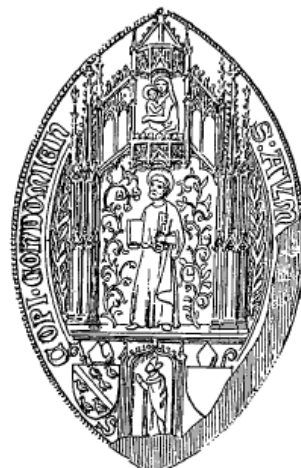
S. AYM[ERICI] EPI[SCOPI] CONDOMIEN[ISIS].