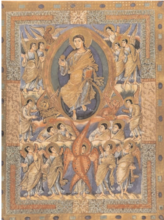
10. Sacramentaire de Metz, Paris, BnF, ms. lat. 1141, f. 5 (d'après F. Mütherich et J.E. Gaehde, Peinture carolingienne).