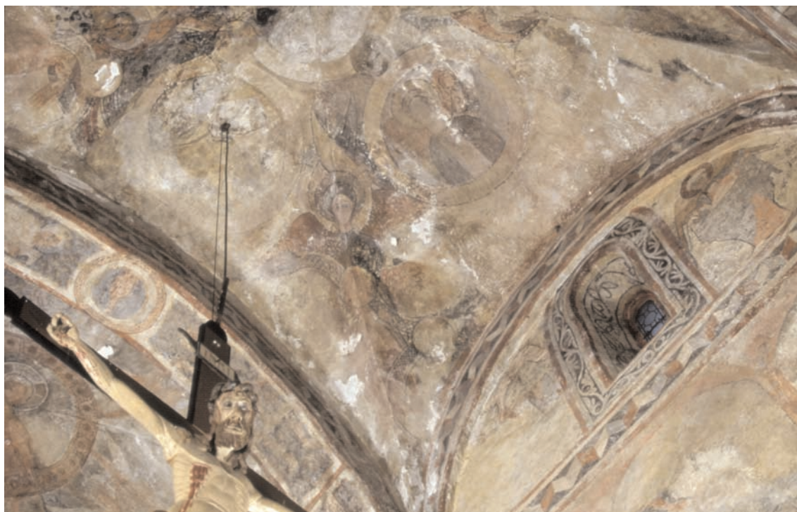
14. Saint-Aventin, église Saint-Aventin, première travée du chœur; voûte, ange hexaptéryge supportant le médaillon de l'Agneau (cliché Jean-Pierre Brouard, CESCO).