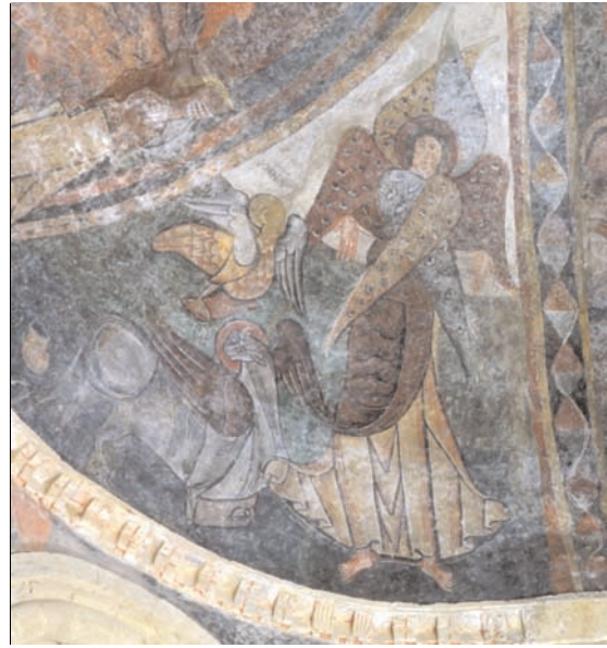
7. Montgauch, église Saint-Pierre, peintures du cul-de-four: séraphin, aigle de saint Jean et bœuf de saint Luc.

L'illustration de la préface reprend les termes principaux du texte liturgique, mais