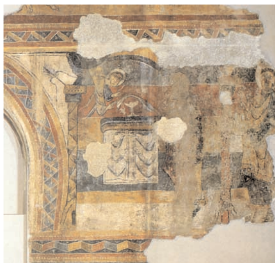
17. Taüll, église Santa Maria, bas côté sud de la nef, apparition de Gabriel à Zacharie (d'après Carbonell i Esteller et Sureda i Pons, Tesoros Medievales ).