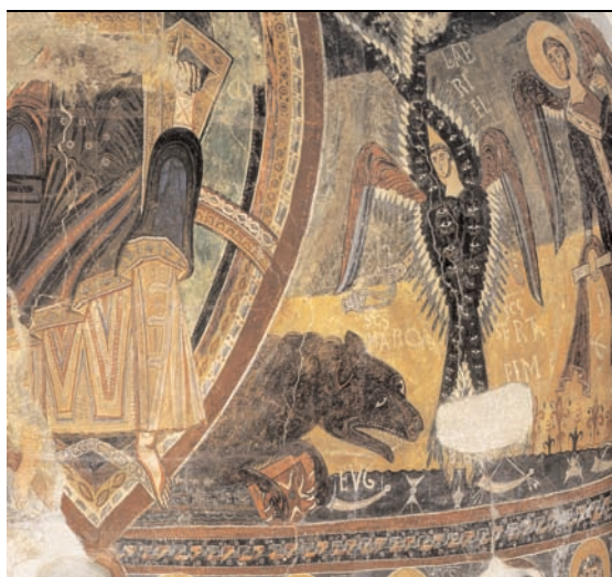
16. Esterrri de Cardós, église Sant Pau, peintures du cul-de-four, séraphin thuriféraire (d'après Carbonell i Esteller et Sureda i Pons, Tesoros Medievales ).