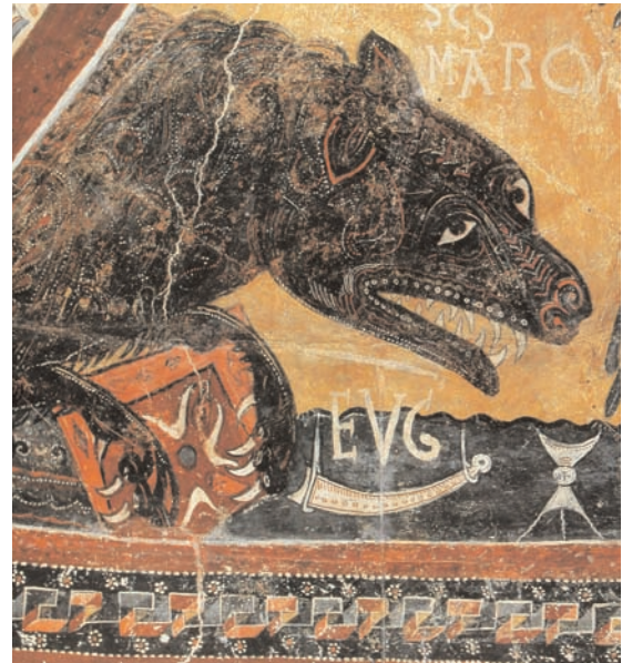
20. Esterri de Cardós, église Sant Pau, peintures du cul-de-four, objets liturgiques (d'après Carbonell i Esteller et Sureda i Pons, Tesoros Medievales ).

En Catalogne, le quatrième exemple de programme corrélant l'encensement à l'eucharistie se trouve à Sant Pere de Sorpe. Sur la paroi septentrionale de ce petit édi-