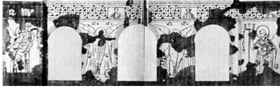
13. Rome, église Saint-Laurent-hors-les-Murs, abside, relevé des peintures de la tribune du narthex (d'après G.B. de Rossi).

Saint-Géréon de Cologne 50 et sacramentaire de Tynieć, deux manuscrits issus des scriptoria de Cologne 51 . On pourrait ajou-