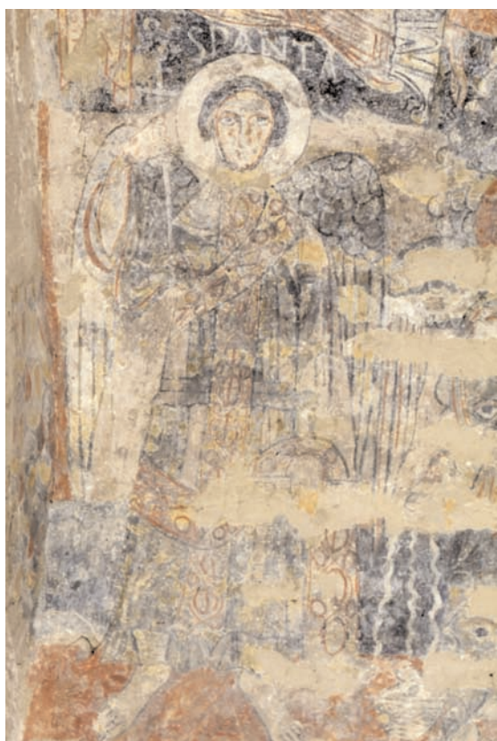
21. Vals, église Sainte-Marie, voûte en berceau du chœur, côté nord, archange Pantasaron.

position assise du Christ expriment une idée analogue, manifestant ainsi une des dimensions fondamentales de la puissance divine.