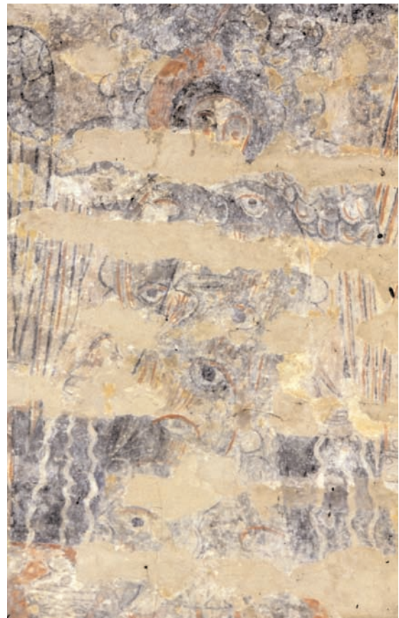
15. Vals, église Sainte-Marie, voûte en berceau du chœur, côté nord, chérubin thuriféraire.

Dans la vision d'Isaïe, un des séraphins s'approche du prophète pour lui purifier les lèvres avec un charbon brûlant qu'il a pris à l'autel au moyen de pincettes (Is 6, 6-7). À Santa Maria d'Àneu, le thème a été appliqué à deux prophètes –Élie et sans doute Isaïe– sur la paroi de l'abside ( fig. 1 ) 83 . En inscrivant une image impliquant un autel derrière le maître-autel de l'église, le programme induit avec force une lecture eucharistique de cette vision prophétique. Dans les commentaires occidentaux du Livre d'Isaïe, la purification des lèvres renvoie pourtant aux sacrements du baptême