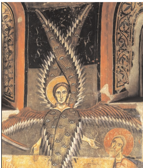
1. Àneu, église Santa Maria, peintures de l'abside (d'après Carbonell i Esteller et Sureda i Pons, Tesoros Medievales ).

confondu les deux êtres célestes: on les a au contraire fusionnés en leur attribuant d'une part le visage unique et les six ailes des séraphins, et d'autre part les yeux répandus sur quatre ailes seulement propres aux chérubins. Parfois, on leur a attribué les roues de feu de la vision de Daniel (Dn 7, 9), un thème renvoyant également à la vision d'Ézéchiel même si les roues accompagnant les chérubins n'y sont pas enflammées (Ez 1, 15-21 et 10, 9-11) 12 . À Àneu et Estaon enfin, on leur a associé le triple sanctus de la vision d'Isaïe (Is 6, 3). En confrontant dans la même composition un chérubin à un séraphin tout en leur