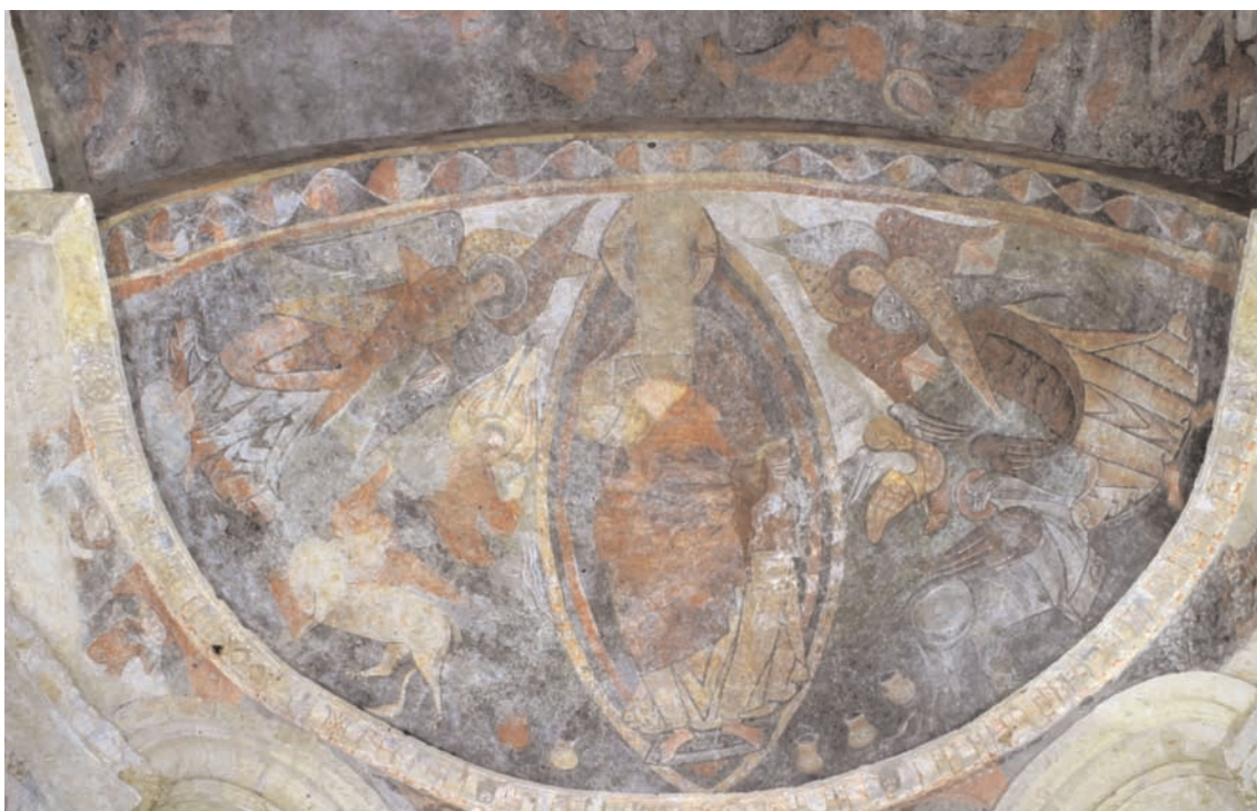
6. Montgauch, église Saint-Pierre, peintures du cul-de-four.

puissances tremblent et les vertus ainsi que les séraphins concélébrent avec joie 31 . Ces mots sont suivis du chant du sanctus qui clôt la préface. Dans le texte du canon, les hiérarchies célestes ne sont plus invoquées, mais la présence divine est affirmée avec encore plus de force. Dans la demande de sanctification –le Supplices – on sollicite les anges pour qu’ils portent les supplices sur l’autel, devant la majesté de Dieu 32 . La préface et le canon affirment ainsi, au même titre que quantité d’autres textes médiévaux, la participation de l’Église céleste à la liturgie terrestre 33 .