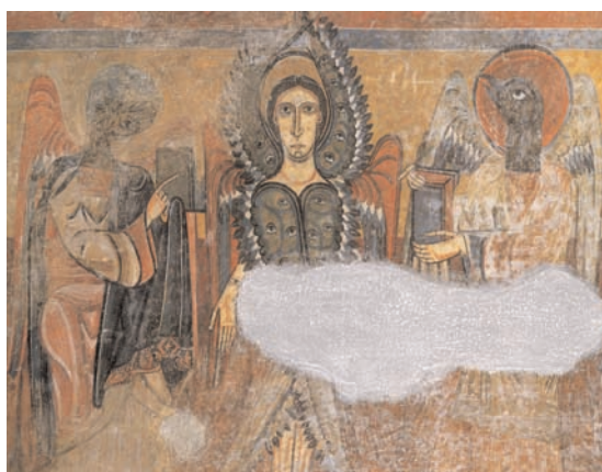
5. Taüll, église Santa Maria, chœur, voûte en berceau, côté sud: saint Marc, ange hexaptéryge et saint Jean (d'après Carbonell i Esteller et Sureda i Pons, Tesoros Medievales ).

Cette série se distingue en tout cas par sa singulière régularité: sept occurrences figurent dans le cul-de-four, les deux autres –Santa Maria de Taüll et Vals– ayant été disposées sur une voûte en berceau du chœur. Les anges hexaptéryges figurent entre les Vivants et l'arc absidal ou les