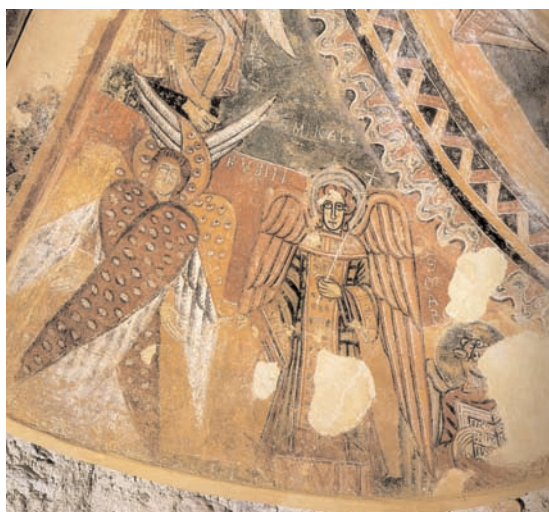
9. Sant Tomàs de Fluvià, cul-de-four, chérubin, saint Michel et saint Marc (d'après Catalunya Romànica, IX).

passages pourraient également s'appliquer au sacramentaire de Metz puisque le globe servant de trône au Christ est tangent à la partie inférieure de la mandorle, si bien que le séraphin supporte à la fois le firmament et le trône du Seigneur. Si en Orient le thème des chérubins supportant le firmament ou le ciel a été transposé très fidèlement à plusieurs reprises, comme dans l'Ascension des Évangiles de Rabula 41 , en Occident, il a été appliqué majoritairement à des anges hexaptéryges 42 .