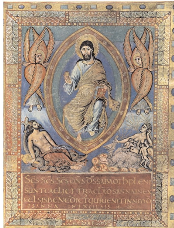
11. Sacramentaire de Metz, Paris, BnF, ms. lat. 1141, f. 6. (d'après J. Hubert, J. Porcher et W.F. Volbach, L'empire carolingien).

ment scripturaire susceptible de la justifier, mais il atteste dans le même temps que dans la pratique liturgique du IV e siècle, on avait appliqué aux séraphins la fonction de support du trône divin propre aux chérubins. Aussi pourrait-on supposer, avec prudence, que le concepteur du sacramentaire de Metz a opéré le même transfert dans le but d'inclure symboliquement l'ordre des chérubins dans les hiérarchies célestes représentées.