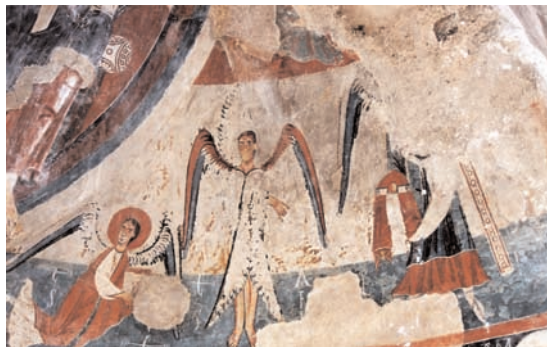
2. Baiasca, église Sant Serní, peintures du cul-de-four, côté sud (cliché Montserrat Pagès).

attribuant sciemment une apparence identique découlant de la fusion des deux visions bibliques, le concepteur a clairement laissé transparaître une réflexion savante vouée à l'iconographie de ces êtres célestes et, selon toute vraisemblance, une volonté de leur attribuer des fonctions analogues, voire identiques.