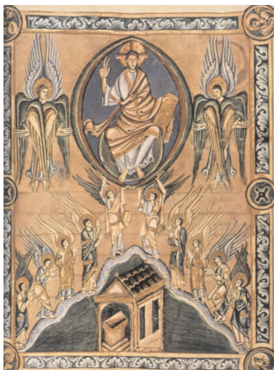
12. Sacramentaire de Saint-Denis, Paris, BnF, ms. lat. 9436, f. 15v (d'après L. Grodecki et al., Le siècle de l'An Mil ).

Dans les autres sacramentaires ou dans les missels, les séraphins associés à la préface peuvent figurer seuls –Missel bénédictin à l'usage d'une collégiale ou abbaye de chanoines réguliers de Troyes 47 , Missel