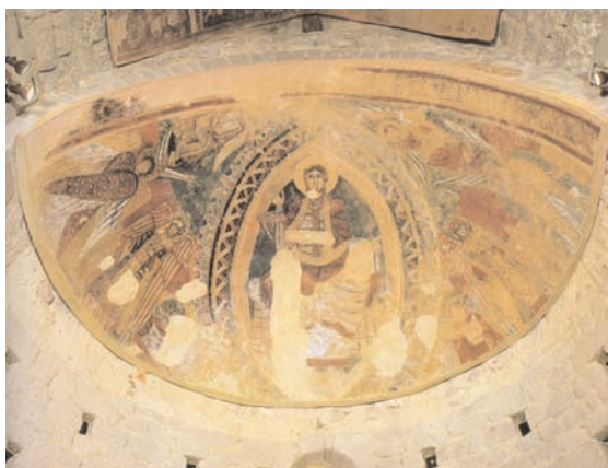
8. Sant Tomàs de Fluvià, cul-de-four, vue d'ensemble (d'après Catalunya Romànica, IX).

texte illustré, mais les chérubins en sont manifestement absents. On notera cependant que le séraphin supporte sur ses deux ailes supérieures la mandorle divine dont le bord extérieur est parsemé d'étoiles, un thème renvoyant à la première vision d'Ézéchiel: "Dominant la tête de ces êtres –les tétramorphes qualifiés plus loin de chérubins–, il y avait quelque chose qui