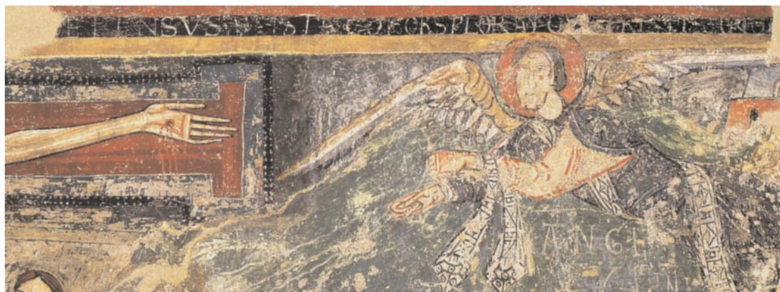
19. Sorpe, église Sant Pere, paroi nord, détail de la Crucifixion, (d'après Carbonell i Esteller et Sureda i Pons, Tesoros Medievales ).

thème apocalyptique n'apparaît pourtant ni dans les commentaires, où l'ange est généralement assimilé au Christ, ni dans la liturgie 114 . Aussi peut-on supposer que le concepteur a développé une sorte d'exé-