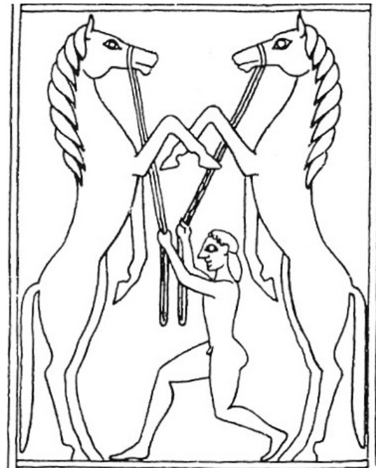
Fig. 5: Plaque décorée de bouclier en bronze, Olympie, n° B 987, VII e siècle av. J.-C. (dessin d'après Kunze 1950).