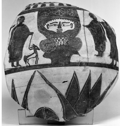
Fig. 2: Tesson chypriote décoré dans le « style d'Amathonte », n° AM 393d, Musée du Louvre, seconde moitié du VI e siècle av. J.-C.

26 fragments de chapiteaux – dont certains archéologiquement complets – ont été mis au jour un peu partout sur l'île; ils s'échelonnent de la première moitié du VI e siècle avant J.-C. 3 à l'époque classique (vers la fin du V e siècle avant J.-C.) 4 . La fonction exacte de ces artefacts est encore mal connue et ne semble d'ailleurs pas univoque; à ce jour, plusieurs pistes sont ouvertes: certains d'entre eux pourraient avoir servi de supports architecturaux, comme le montre notamment la présence de mortaises au lit d'attente et de lignes de poses incisées 5 , et d'autres, d'objets de vénération, sous la forme d'un pilier cultuel, comme semble l'attester une représentation sur un tesson décoré dans le « style d'Amathonte », daté du VI e siècle av. J.-C., et qui présente ce qui semble bien être une scène d'adoration et de sacrifice autour d'un chapiteau hathorique isolé (fig. 2).