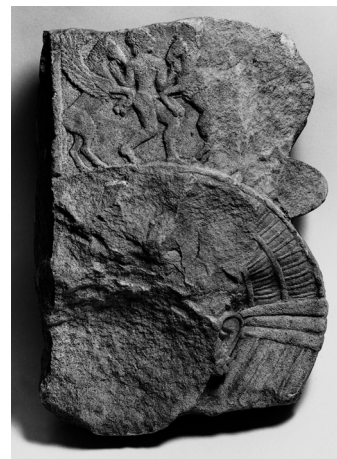
Fig. 1: Chapiteau hathorique n° SK 1903, Staatliche Museen, Berlin.