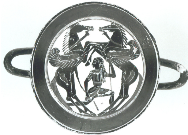
Fig. 3: Coupe laconienne de Capoue, n°B2, British Museum, vers 560 avant J.-C.

Sur une bande de bouclier en bronze d'Olympie datée du VII e siècle, on voit Bellérophon tenant Pégase par la bride et attaquant Chimère avec un