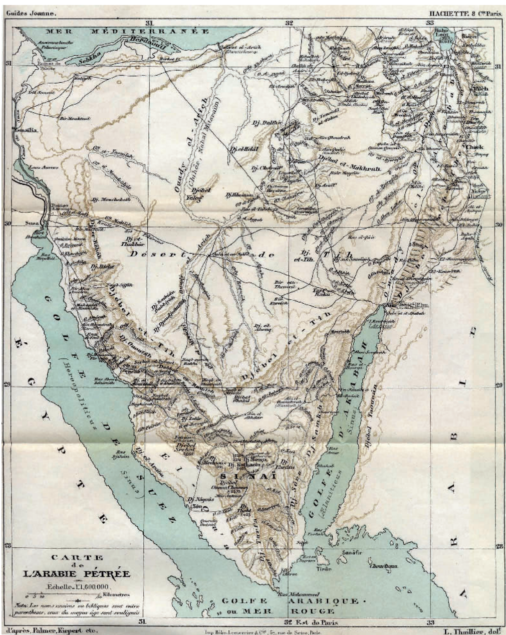
Fig. 4 : « Carte de l'Arabie pétrée» reproduite dans deux volumes de la trilogie et dans l'extrait Péninsule Sinaïtique .

Cette formule permettait de rentabiliser la coûteuse cartographie en couleurs (fig. 4). Dans notre exemple, la même carte dépliant apparaît dans trois volumes différents: II, Égypte-Abyssinie (1881), le portfolio lié à III, Syrie-Palestine (1882) et enfin l'extrait Péninsule Sinaïtique (1891). Les voyageurs qui n'auraient peut-être pas acquis le volume complet consacré à l'Égypte pouvaient acheter un petit ouvrage traitant de leur excursion. La même formule sera ensuite appliquée pour Bosnie-Herzégovine (1897) et Le Caire (1909): ces extraits deviennent des monographies autonomes.