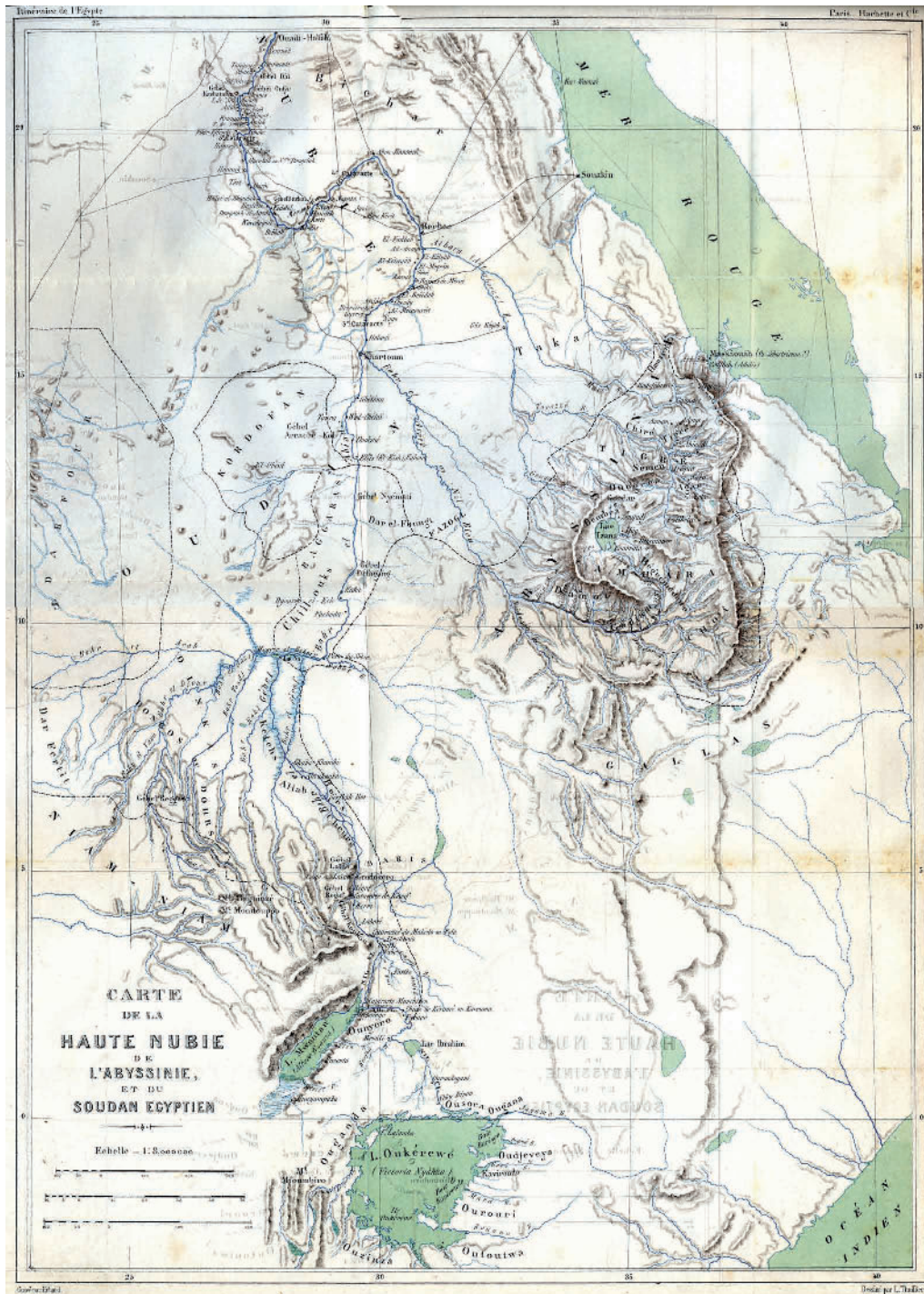
Fig. 3 : « Carte de la Haute Nubie, de l'Abyssinie et du Soudan égyptien », extraite de ISAMBERT 1878, insérée entre les p. 668 et 669.

du Soudan» 29 , sont indiqués très brièvement les moyens de transport (le bateau à vapeur principalement) et quelques grands traits sur les régions traversées jusqu'à Gondokoro, siège d'une garnison de tirailleurs du protectorat anglais de l'Ouganda.