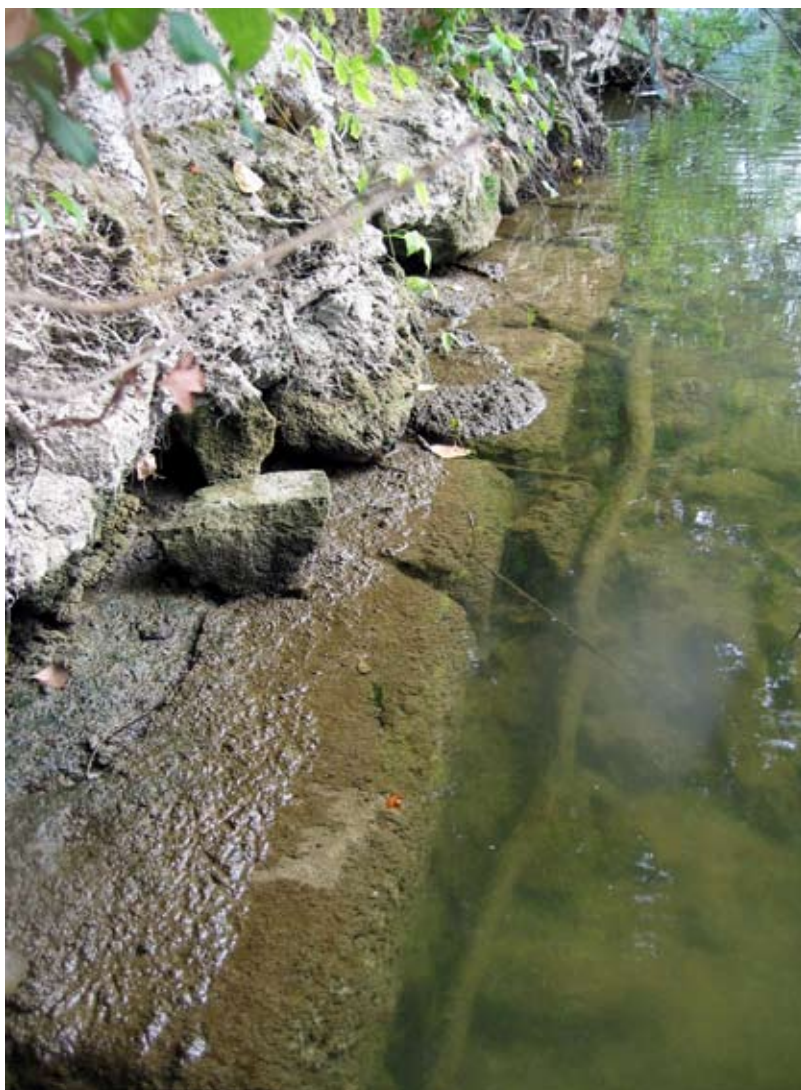
2. Des alignements de gros blocs taillés, repérés en plusieurs endroits sur la rive gauche du Doubs, matérialisent les vestiges de probables renforcements de berge.