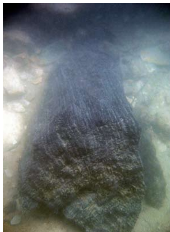
1. datation dendrochronologique par le laboratoire CEDRE de Besançon

donc bien attestée sous la forme de dépôts d'inondations recouvrant les niveaux d'occupation dès le milieu du 1 er siècle de notre ère. Ces différentes occurrences de crues du Doubs au début de l'époque gallo-romaine sont synchrones de celles enregistrées dans les bassins voisins du Rhin, de la Saône et du Rhône.