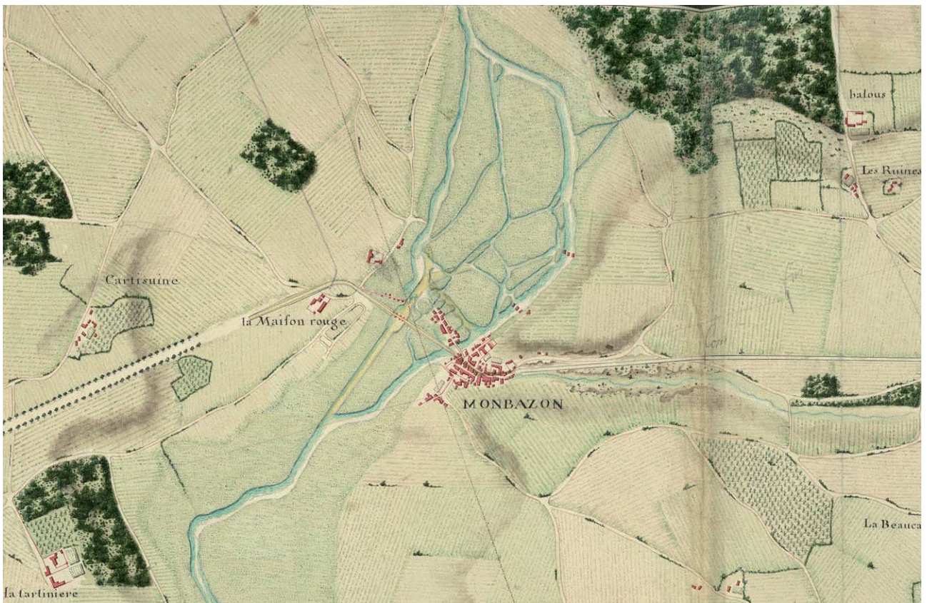
Document 1. Atlas de Trudaine. Extrait de la feuille n° 8505P018R01_H, Archives nationales.