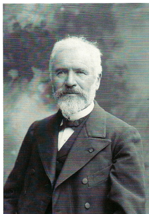
Collection Ecole Polytechnique