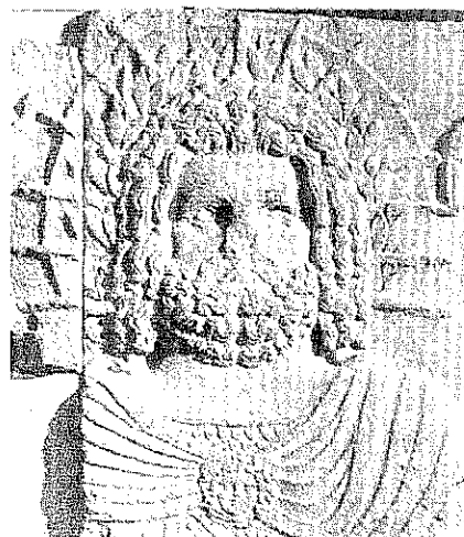
Fig. 3. Relief de Louxor. Partie supérieure droite.