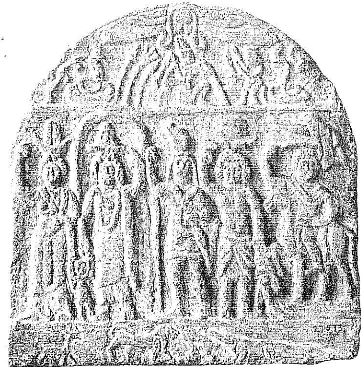
Fig. 4. Stèle de Louxor. Musée du Caire 27573.

gement, sur la fréquence des témoignages sarapiaques en Haute Égypte 16 .