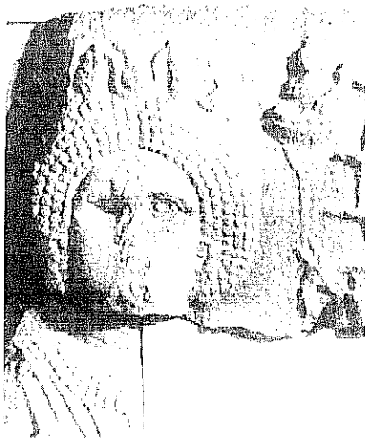
Fig. 2. Relief de Louxor. fragment supérieur gauche.

Reprenons la description qu'en a donnée Z. Kiss 3 , en la précisant et en supprimant les commentaires interprétatifs du savant polonais (fig. 2). Sur la partie gauche du relief 4 se trouve une femme debout, au large faciès et aux yeux autrefois incrustés ; elle est pourvue d'une haute chevelure en demi-cercle, rendue par six rangées de boucles alignées et parée d'un diadème au centre duquel on reconnaît un disque solaire surmonté d'un objet de forme relativement évasée, le tout enserré par des cornes de vache : de son corps ne subsiste plus que la moitié gauche, une partie du relief ayant