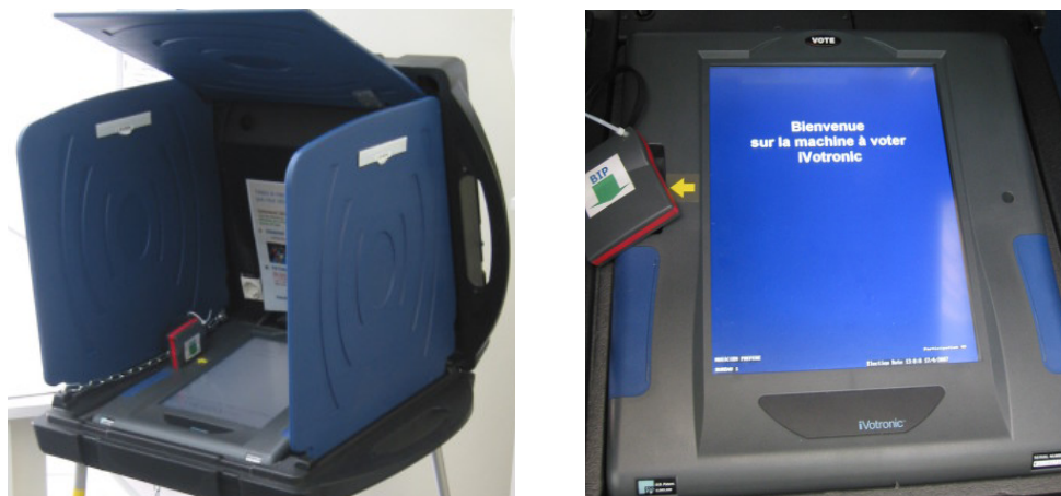
OdV-BD « iVotronic » de la société ES&S Datamatique