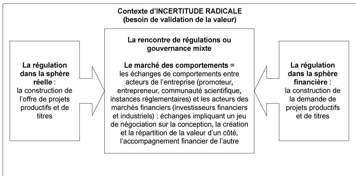
Figure 1. Le jeu de la gouvernance mixte : rencontre de régulations et échange de comportements