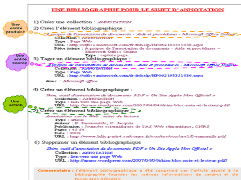
Fig. 3 – Une partie du document résultant de la redocumentation de la trace du professeur

Nous supposons que l'utilisateur dispose d'un module de redocumentation automatique facilitant sa tâche. Une fois activé, ce module initialise un fichier texte (document résultant) et lui attribue certaines informations (titre, auteur, date). Si l'utilisateur sélectionne graphiquement une partie de sa trace visualisée à redocumenter, ce module utilise des règles de réécriture pour transformer les éléments de la trace modélisée en une description textuelle. A titre d'exemple, si la trace comporte une action ajouter dont l'entité produite est de type collection , alors la phrase « Créer une collection : » sera générée dans le fichier texte, suivie du nom de la collection. Si la partie sélectionnée de la trace comporte une suite d'actions alors chaque ligne du document texte généré pourra contenir la description d'une action, suivie de la description de ses entités ressources et productions. L'utilisateur pourra paramétrer la représentation du temps des observés de la trace dans le document résultant, et la présentation des parties textuelles (l'utilisation d'une section pour chaque action, le choix de la typographie et des couleurs des descriptions, etc.). Il pourra aussi ajouter des commentaires à son document (justification, information, lien à d'autres parties, etc.). Une fois terminé, l'utilisateur enregistrera le document résultant dans un format particulier (Word par exemple).