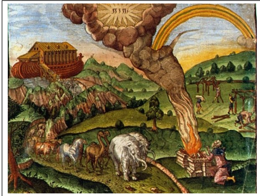
[Th. de Bry, L'Arche de Noé, II, 00]

Les rappels à l'Histoire des Hébreux peuplent une partie de la représentation des Amérindiens. De Bry a lui-même opté pour un double lien entre ces peuples : d'abord la planche représentant les parents de l'Humanité, puis, dans le deuxième volume, dans une remarque au « lecteur bienveillant » 39 , c'est au tour de l'Arche de Noé d'amarrer sur le continent américain. Echoués sur le mont Ararat, que De Bry semble situer en Amérique, les animaux 40 sortent par couple, et Noé remercie son dieu par un holocauste des animaux les plus purs, ainsi que les Ecritures le précisent 41 . L'arc-en-ciel en haut à droite rappelle l'Alliance entre Yahvé et la Terre 42 . Dans la scène du second plan, les fils de Noé s'affairent à construire les premières maisons, pour leurs familles. Tous, même Cham, mettent le cœur à l'ouvrage. Le commentaire associé à l'image précise toutefois la prise de position de l'auteur : parlant des habitants de la Floride, il précise, entre parenthèses, qu'ils « descendent sans doute d'un des fils de Noé, mais plutôt de Cham que d'aucun des autres,