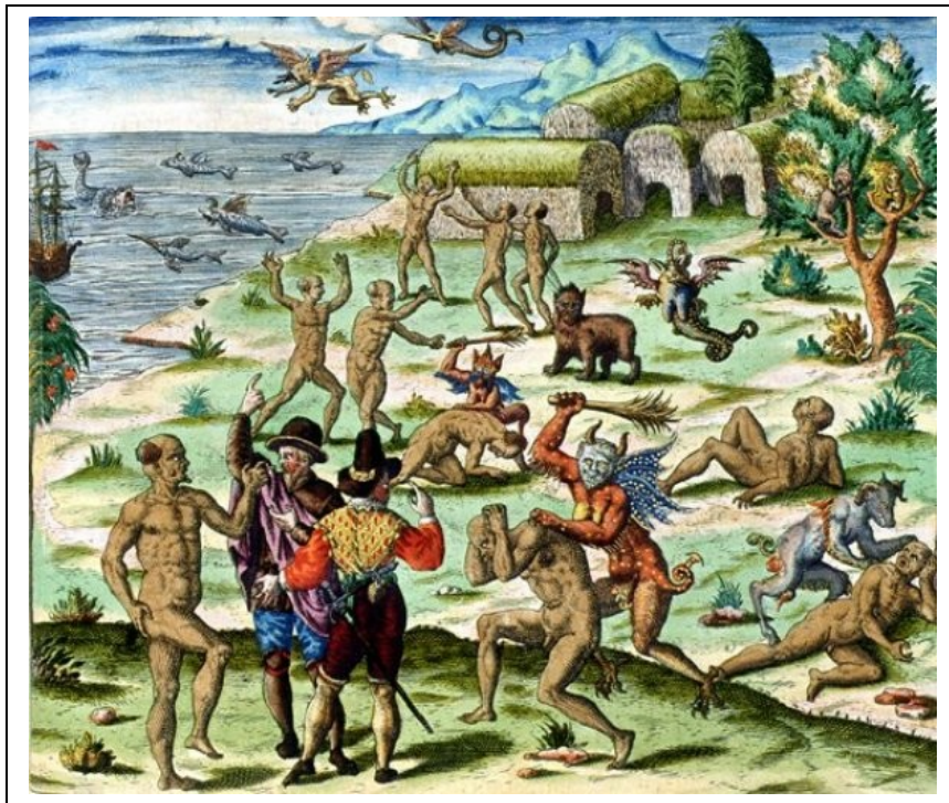
[ Les Brésiliens persécutés par les démons , planche III, 27]

Les protestants semblent partager la même opinion. En effet, dans la planche 27 de son troisième volume, Théodore de Bry regroupe les images fantastiques que s'étaient créées les Européens du XVI e s. : Les Brésiliens persécutés par les démons .