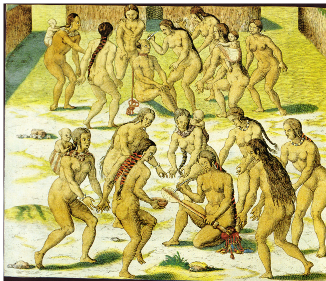
[Figure III, 20 : le rôle des femmes]

La durée de captivité pouvait varier de quelques heures, pour les plus âgés, à près de vingt années pour les jeunes 95 . Le conseil des chefs de famille et des principaux chefs de la tribu se réunissait pour déterminer la date de l'exécution, puis « des messagers étaient envoyés dans les villages alliés pour [...] inviter à la fête » 96 les parents et les amis de la famille qui sacrifiait le prisonnier. S'en suit une préparation du matériel destiné à servir lors de l'exécution rituelle : la corde ( mussurana 97 ou massarana ), la massue sacrificielle ( iwera pemme 98 ) et enfin la boisson enivrante ( caouin 99 ou cahouin ). De Bry n'a pas pris le soin de développer ces préparatifs qui durent les cinq jours précédant l'exécution 100 , et s'est concentré sur la préparation du corps pour la dégustation.