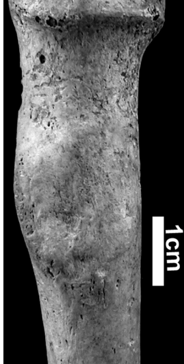
Figure 1. Enthèse fibrocartilagineuse sur os sec. Insertion du m. biceps brachial. La surface est lisse, sans trace de vascularisation et les contours de l'enthèse sont bien définis.

souvent uniquement fondée sur l'existence d'une relation, plus ou moins directe, entre cette modification et un processus mécanique. Cependant, de plus en plus de travaux méthodologiques sont publiés et l'on peut espérer dans le futur la généralisation d'études de MOA conscientes de leurs limites, dans lesquelles seront proposées des interprétations raisonnées et non plus « hautement spéculatives ».