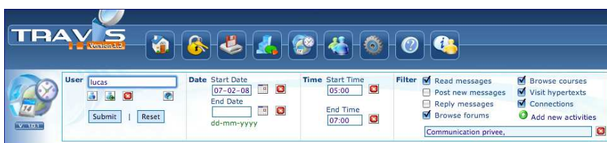
Figure 3. La vue principale de plateforme TrAVis.