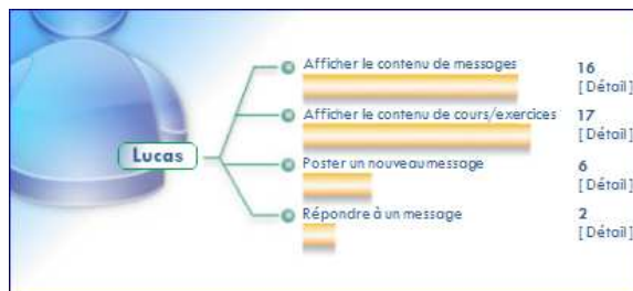
Figure 6. Indicateurs concernant le profil d'un utilisateur.

Sur la figure 4, chaque sphère représente une action de lecture d'un message par un utilisateur. Le diamètre de chaque sphère est proportionnel au temps passé par un utilisateur pour la lecture. La distance entre deux sphères représente le temps écoulé entre deux lectures. Une sphère peut être de quatre couleurs (orange, bleue, verte, ou grise). Une sphère verte signifie que l'utilisateur a ouvert un message en ayant bougé le « scrollbar » vertical vers le bas pour voir la totalité du message (on peut supposer dans ce cas que la lecture a été effectuée jusqu'à la fin du message, même si on laisse le soin à l'utilisateur d'interpréter cet indicateur). La sphère orange exprime le fait que l'utilisateur a seulement affiché le début du contenu du message sans toucher le « scrollbar ». La sphère bleue signifie que l'utilisateur a affiché le message, et qu'il a bougé le « scrollbar » mais sans aller jusqu'en bas (affichage partielle d'un message). Enfin, la sphère grise indique que l'utilisateur n'a fait qu'un passage éclair sur un message (moins de 3 secondes).