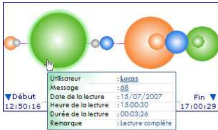
Figure 4. Indicateurs d'interaction de tous les utilisateurs qui ont effectué une activité « Lecture d'un message ».

est-ce que le message n'a été lu que partiellement, et (iii) pendant combien de temps le message a été lu.