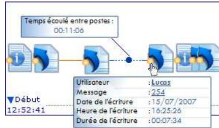
Figure 5. Indicateurs pour deux activités « Poster un nouveau message » et « Répondre à un message ».