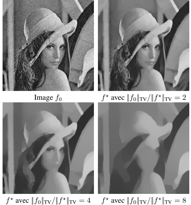
FIG. 1 – Exemples de débruitage par projections sur la boule TV pour différents \tau calculées par notre algorithme.

Comme le coût d'une itération de l'algorithme de Nesterov est environ le double de celui des autres algorithmes, nous montrons en fait l'erreur générée par f^{(k/2)} au lieu de f^{(k)} pour la courbe de la méthode de Nesterov. Ceci montre que les vitesses observées coïncident avec les prédictions théoriques, et que l'algorithme de projection dual avec itérations de Nesterov est plus rapide que les deux autres méthodes.