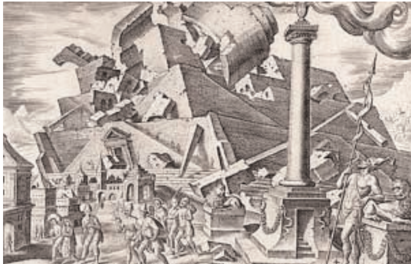
Philip Galle, Histoire de la tour de Babel 1558 gravure sur cuivre, 34,2 x 42,1 cm Berlin, Kupferstichkabinett