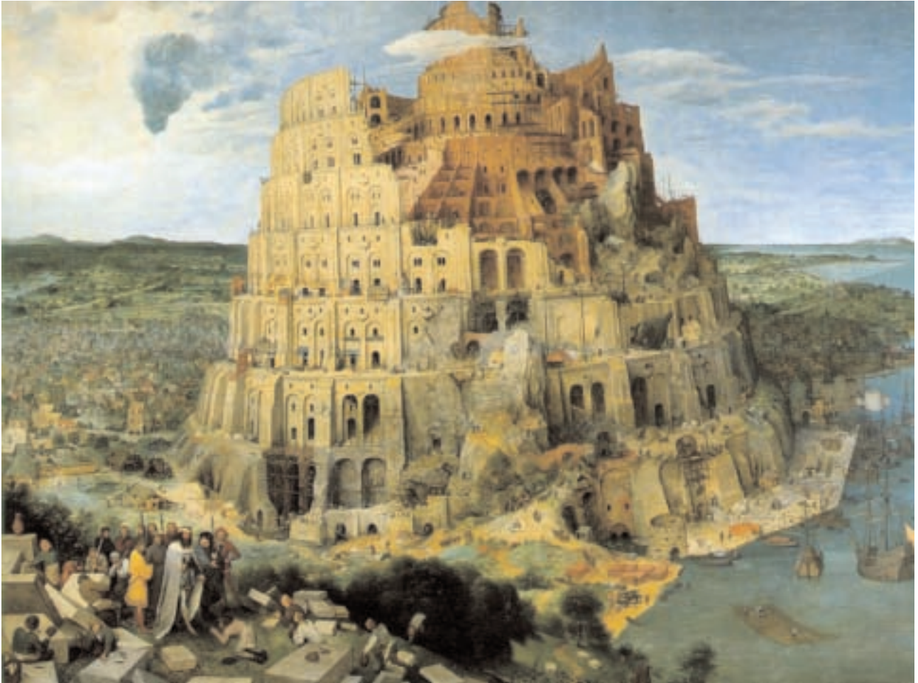
Peter Bruegel l'Ancien, La Tour de Babel («La Grande Tour»), 1563 huile sur bois 114 x 155 cm, Vienne, Kunsthistorisches Museum