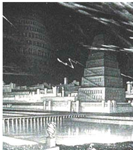
John Martin, The Fall of Babylon , détail

d'eau, pendant que des éclairs zèbrent le ciel. Dans l'arrière-plan se dresse une ziggourat conforme aux représentations qu'en donne l'archéologie moderne. Mais on distingue à ses côtés une tour infiniment plus grande, construite sur le plan circulaire cher à Bruegel :