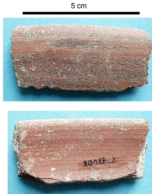
Fig. 7 : Zeugma, fragment de plat à engobe italien (?) n° inventaire 20027.2