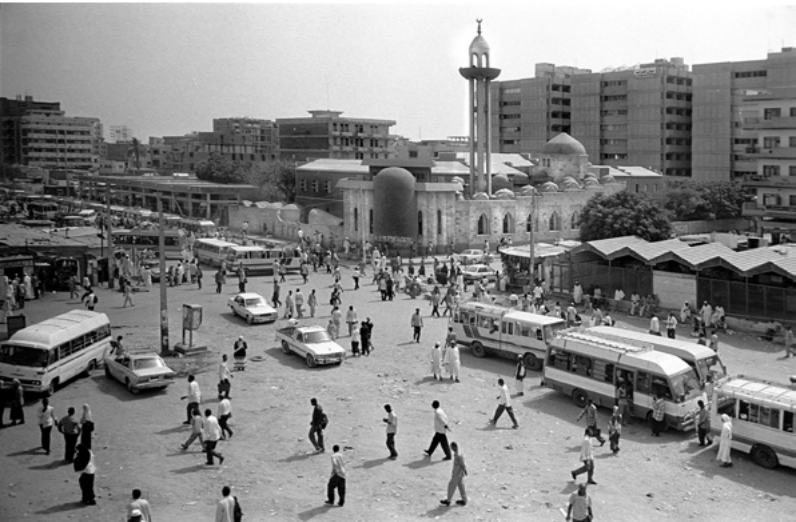
Souk al- arabi , gare routière, Khartoum, 1999.