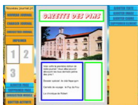
Figure 2 : outil de rédaction de journaux

L'étude expérimentale a été réalisée dans le cadre du projet MNESIS financé par le Ministère de la Recherche (appel « Usages de l'Internet »). Notre objectif était d'étudier les répercussions cognitives et psychosociales liées à l'usage d'un l'environnement technologique, Activital™, (Activital, 2008) sur une population de personnes très âgées résidant dans 7 EHPAD (Etablissement d'Hébergement pour Personnes Agées Dépendantes). Activital propose trois activités complémentaires (voir figures 2, 3, 4) : un ensemble de jeux cognitifs , un outil de rédaction de journal de résidence pour développer la créativité et un outil de messaging électronique simplifié pour favoriser les liens sociaux et la communication.