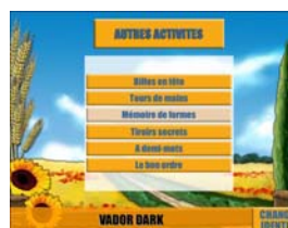
Figure 4 : jeux cognitifs à difficulté variable

Un groupe de résidents a été formé à Activital. Il pratiquait des séances de formation à raison de 2 à 3 séances par semaine (durée de 30 à 45 minutes selon les EHPAD) sur une période de 6 mois de novembre 2005 à avril 2006. Ces sessions étaient assurées par les animateurs de chaque résidence qui avaient reçues pour l'occasion une formation spécifique de la part de la société éditrice du logiciel. Les autres jours, les ordinateurs restaient en libre service pour permettre aux PA de développer leur pratique. Nous avons observé cette expérimentation.