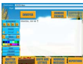
Figure 3 : outil de messagerie électronique