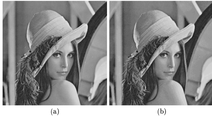
FIG. 3. L'image originale (a) et l'image reconstruite (b) sur 39 niveaux pour un PSNR de 38,52 dB.