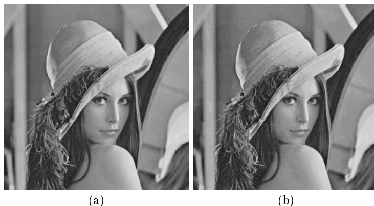
FIG. 3. L'image originale (a) et l'image reconstruite (b) sur 39 niveaux pour un PSNR de 38,52 dB.