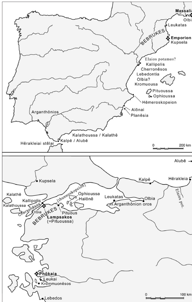
Fig. 2. Localisation des correspondances toponymiques et choronymiques en Ibérie et dans le nord-ouest de l'Asie Mineure (les échelles sont différentes). La localisation d'une bonne part des toponymes ibériques est inconnue, leur placement sur la carte ne doit être considéré que comme une indication approximative