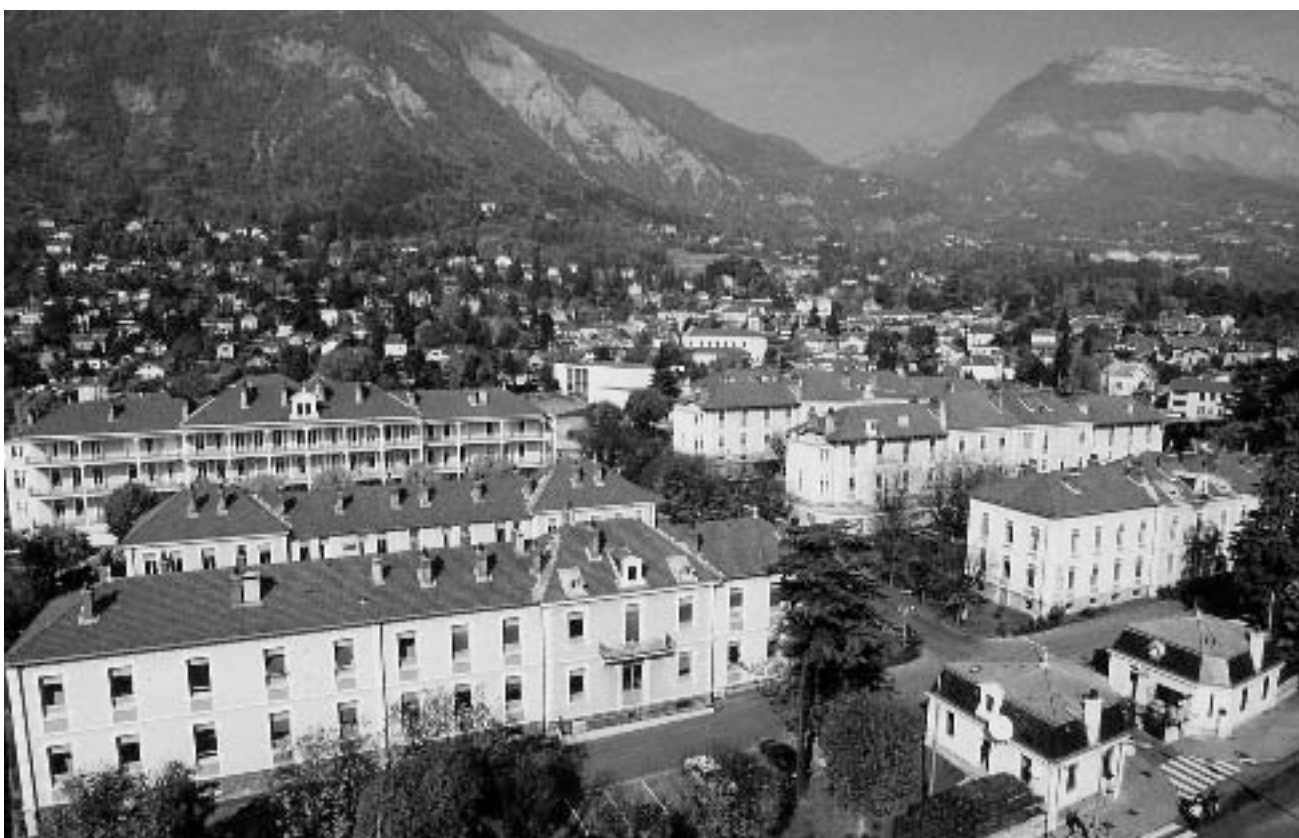
Centre de recherche du Service de santé des armées (CRSSA).